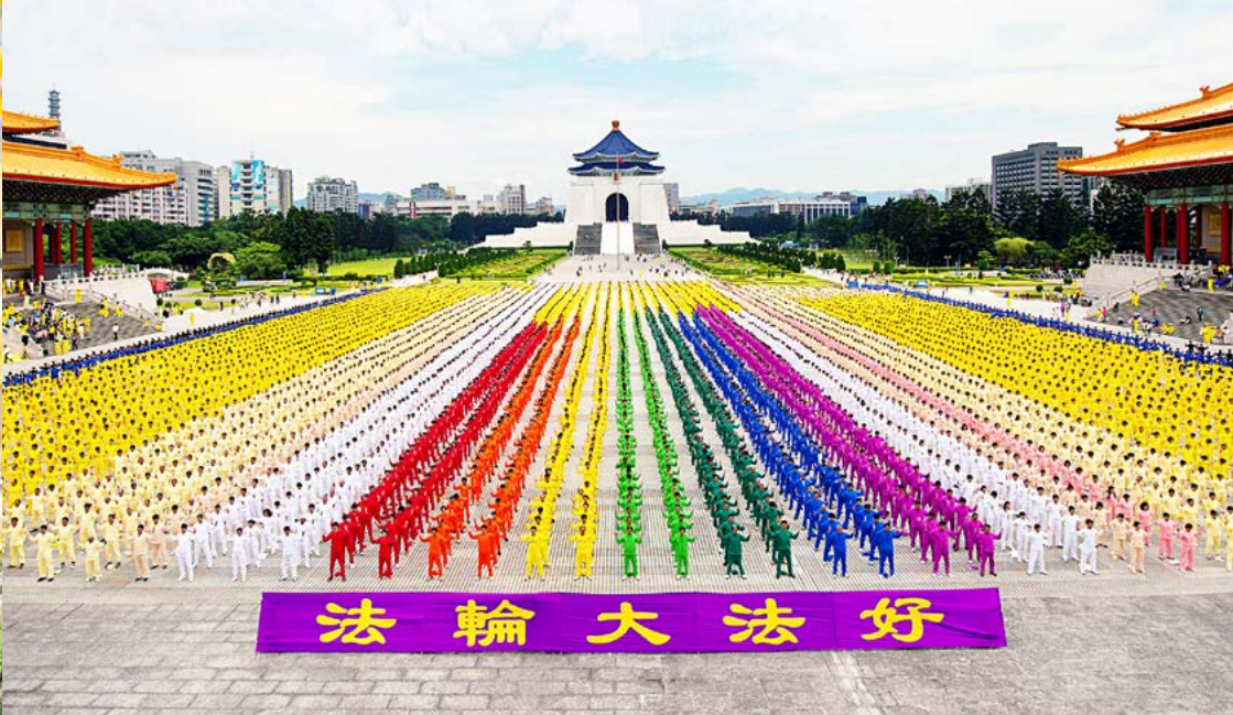
▲台湾七千多名法轮功学员在自由广场集体炼功。

觉得玄，不相信。其实，人肉眼能看到的物质极其有限，看不见、摸不着，而客观存在的物质，在浩瀚的宇宙中才是主体。比如，穴位与经络，虽然肉眼看不到其存在，西医解剖也看不到，可我们祖先却通过修炼发现和记录了准确的经络图，现代科技也印证了其准确性；再比如，看不见、摸不着的放射线，到十九世纪末才由居里夫人发现。人现在能探知的最微观物质是“夸克”，然而人要靠西方科学实证到更微观的“业力”，不知要待到何年！