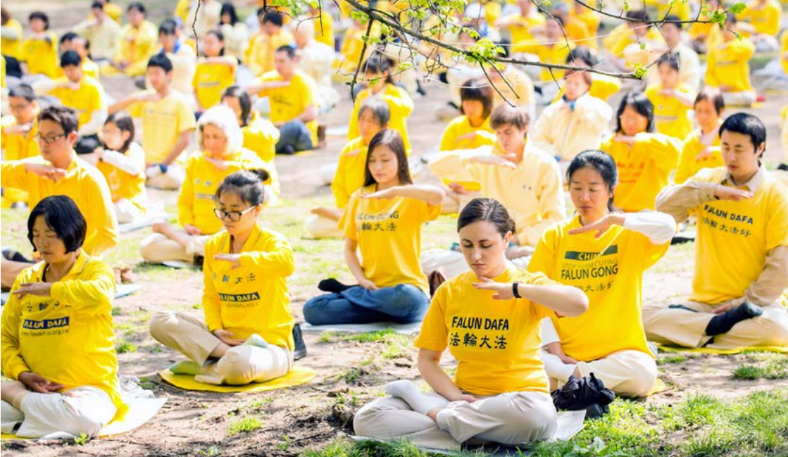
▲法轮功学员在美国纽约的公园里打坐炼功。