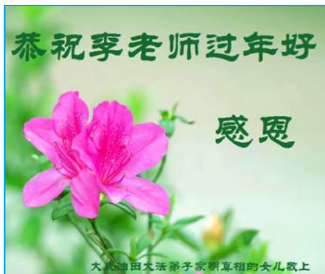
▲在 2019 年皇历新年来临之际，大陆民众给李洪志先生发送的贺卡！