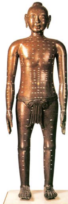
▲古代针灸铜人上的人体经络。肉眼看不到经络，西医解剖也看不到，它却真实存在。