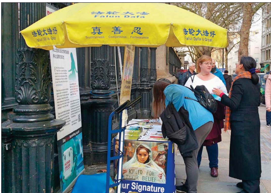
了解真相的民众签名支持法轮功学员反迫害

一位中年西方男士驻足认真观看正在打坐的法轮功学员，然后把目光朝向鼓励中国人三退的中文展板，有法轮功学员用英文告