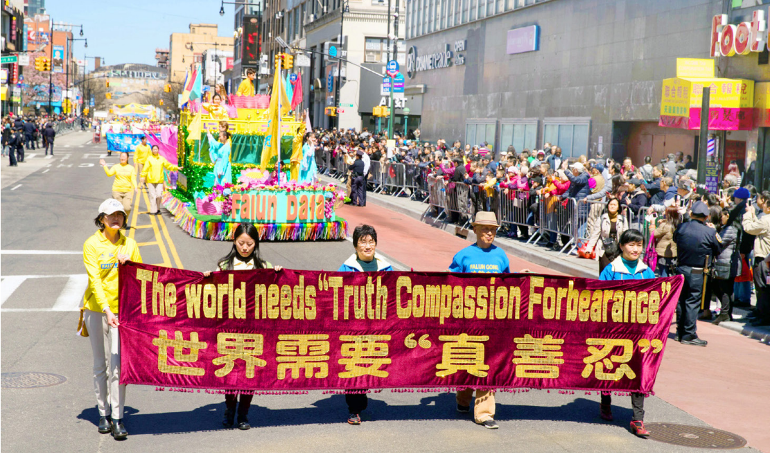
2018年4月美国纽约法轮功学员大游行纪念“四·二五”和平上访19周年