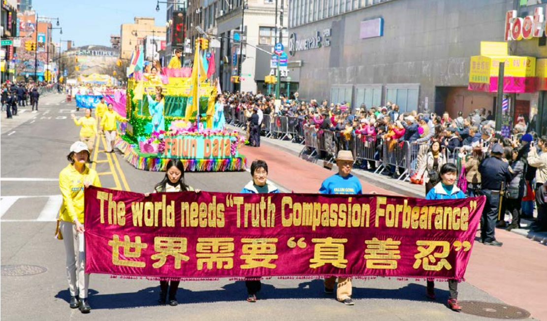
2018年4月美国纽约法轮功学员大游行纪念“四·二五”和平上访19周年