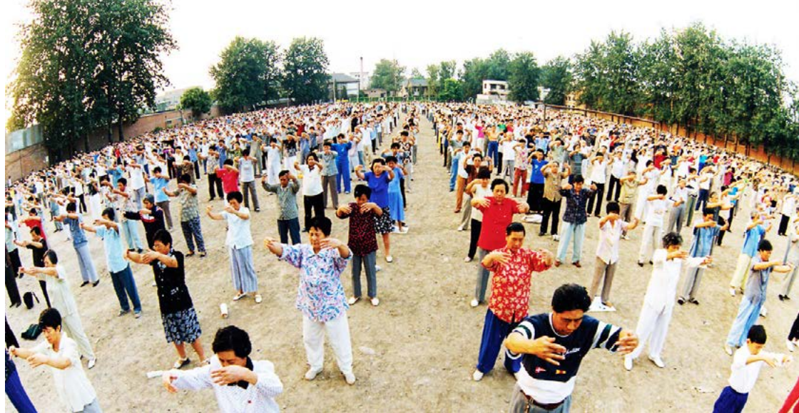
▲ 李洪志先生在北京共举办过十三期法轮功传授班。法轮功学员的晨炼是北京居民的晨炼风景中亮丽的一景。（图片摄于1998年北京）