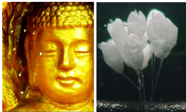
▲图左：韩国佛像上长出的优昙婆罗花。 图右：在400倍的显微镜下的优昙婆罗花。

佛经记载，“优昙花者，此言灵瑞，三千年一现”（《法华文句》），当金轮王（转轮圣王）下世传法时，这天界奇花会在人间绽放。今天，奇花绽放，这天降祥瑞在晓谕世人：圣王已然下世，正法已经开传。