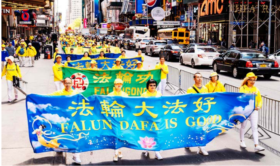
▲ 2019年5月16日，近万名法轮功学员在美国纽约曼哈顿大游行。