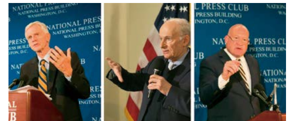
大卫·乔高 大卫·麦塔斯 伊森·葛特曼

2016年6月22日，加拿大国会人权委员会前主席大卫·乔高、著名国际人权律师大卫·麦塔斯和美国资深调查记者伊森·葛特曼，在美国联合发布中共强摘人体器官的最新调查报告。报