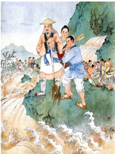
▲在中国有“大禹治水”的传说。大禹治的就是《圣经》中记载的大洪水退去后剩下的那些水。

在世界各地出现的许多文明古迹以及现存的历史资料都见证和记载了人类文明曾多次发生大的劫难。无论是局部的灾难还是全世界的大灾难，其发生时都有一个共同的特征：人类道德极其败坏。或许正是人类道德的堕落才引来了毁灭性的灾难。因为在神的眼里看这些徒具人的外形却没有人的道德的生命已经不再是人了。这样的生命面临的的就是上天的淘汰。