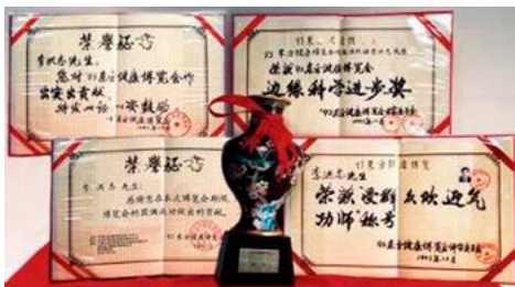
▲ 1993年北京东方健康博览会上，李洪志先生荣获博览会最高奖项“边缘科学进步奖”和大会“特别金奖”，以及“受群众欢迎气功师”称号。

● 1995年1月，法轮功主要著作《转法轮》由中国广播电视出版社出版发行，同年1月4日在北京公安大学礼堂举行了《转法轮》首发式。《转法轮》自出版后一直