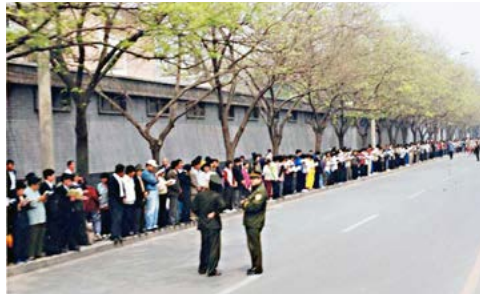
▲ 1999年4月25日上访现场，法轮功学员文明安静，警察不用维持秩序，在一旁聊天。所谓的“围攻中南海”根本就不存在。

1999年4月25日，上万名法轮功学员自发到中共信访局和平上访，所表现出的和平理性和对正信的坚守，得到了国际社会的高度评价，称此次上访是“最理性平和、最圆满的上访”。