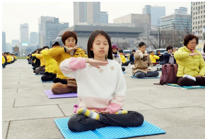
▲打坐可以讓人保持冷靜、延長壽命，給人帶來的許多益處。

在生理指标方面，打坐对他们的帮助还有很多。在救援人员一致认为这群男孩生还概率很小的情况下，他们能够保持冷静的头脑、健康的身体，并最终配合救援人员获救，坦率讲，这是一个奇迹。