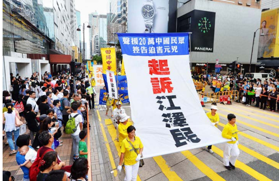
▲ 2016 年 5 月 8 日，香港法轮功学员声援中国民众控告江泽民。

● 堂堂正正在中国国内“诉江”，则是将这股惩恶除奸、匡扶正义的呼声，推向另一波高峰。自 2015 年 5 月起，逾二十万名遭受迫害的法轮功学员及家属，向中共最高检察院和最高法院控告迫害法轮功的元凶江泽民，由于网络封锁和信息传输的不便，实际数字不止于此。