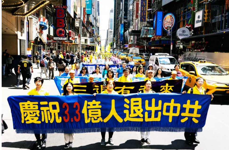
▲ 2019年5月16日，近万名法轮功学员在美国纽约曼哈顿大游行。