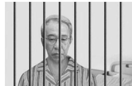
周永康 薄熙来 李东生 徐才厚