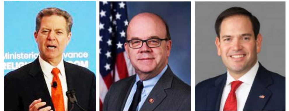
▲ 宗教自由大使布朗巴克 ▲ CECC 主席麦高文和共同主席马克·卢比奥