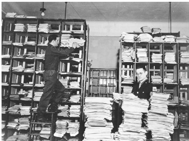
▲纽伦堡审判时期，工作人员在甄选大量的德语文件，这些文件由调查员收集。昔日的上级指令与层层执行者的签名，日后成为纳粹官员们的犯罪证据。