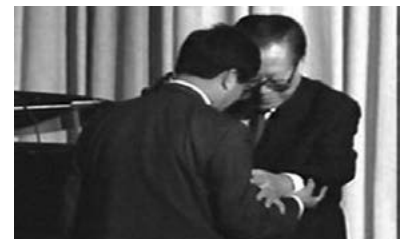
▲ 2002年10月江泽民在美国接到控告状时惊慌失措。

2002年10月22日，江泽民因私访问美国伊利诺伊州芝加哥时，被法轮功学员以酷刑罪和群体灭绝罪等罪行告上伊州北区法庭。