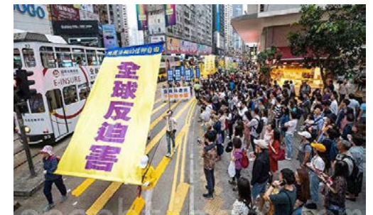
▲ 2019年4月27日，香港法轮功学员举行纪念“四·二五”20周年集会和大游行。

长夜将尽，曙光已现，正义终将彰显。那些仍在参与迫害法轮功学员的各级人员，应该赶快停止迫害，保护法轮功学员，快快三退（退党、退团、退队），并收集其他人的犯罪证据，立功赎罪才是唯一的出路。