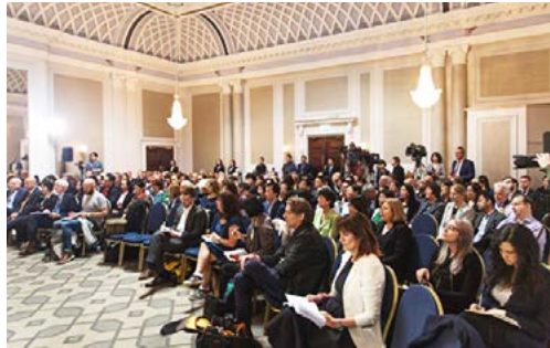
▲ 2019年6月17日，“独立人民法庭”在英国伦敦宣判，当日法庭内聚集了约200名旁听民众及记者。

2019年3月20日，波兰司法部长表示，将起诉一批共产党时期的法官和检察官，这些人参与了对异议人士的迫害。此次被起诉的