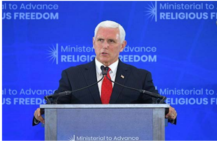
◀ 美国副总统 彭斯