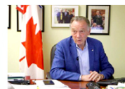
加拿大国会议员彼得·肯特

加拿大国会议员彼得·肯特：制裁人权迫害者，加拿大应比美国做得更多。他同时赞扬法轮功学员和平理性。