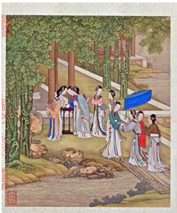
清 陈枚《月曼清游图》册之七月《桐荫乞巧》。

春社、秋社那天，家家户户以鸡猪祭祀土地神，宴请宾客，并且饮用可以治耳聋的社日酒；七月七日晚上牛郎织女渡河相会，妇女们都对着月亮穿七巧针，乞求得到织布绣花的技巧。