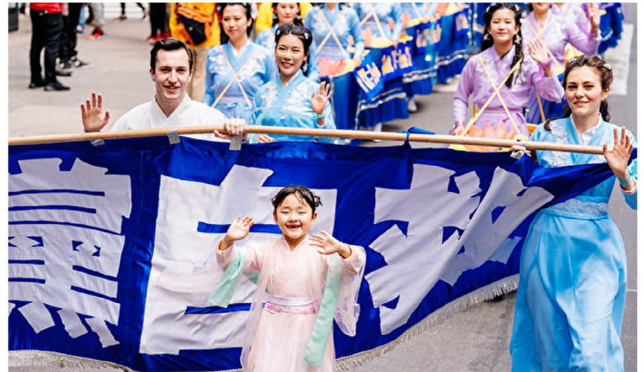
图：来自六大洲的部份法轮功修炼者在纽约曼哈顿，游行庆祝法轮大法洪传27周年，图为“三退保平安”方阵。

多万中国人无辜死亡。现在上天要灭它，会连带它的成员——党员、团员、队员。退出中共组织，是避免天灭中共时受到连累。劝您“三退”的人，是真心为您的平安着想，真心为您好。