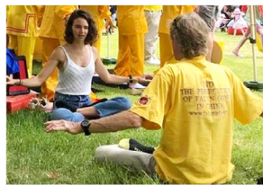
现场有不少民众学炼