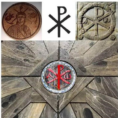
君士坦丁的军队的凯乐符，Windows XP系统名称的灵感，即来源于这个符号

是很现实的，作为异教徒的古罗马人，没有这些治病神迹的显现，他们又怎能放弃从小到大根深蒂固信奉的本土神、转而皈依基督教呢？