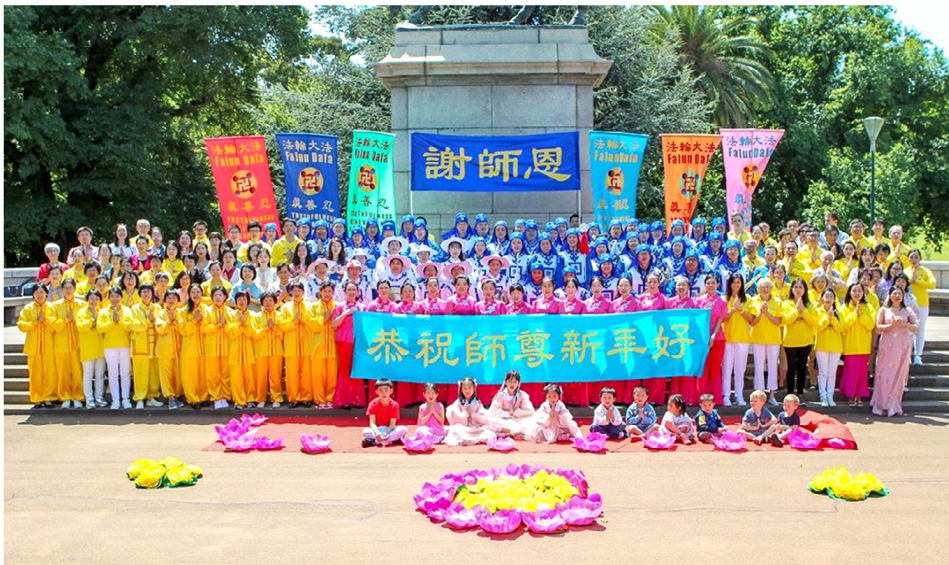
参加澳洲国庆日游行的法轮功学员们集体合影 向慈悲伟大的师尊李洪志大师恭祝新年快乐