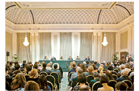
英国独立人民法庭2019年6月17日宣判：中共活摘法轮功学员器官。法庭认定中共是犯罪政权。

当有人把活摘法轮功学员器官的真相，告诉国际社会时，中共卫生系统正式开始建立器官捐献体系，然而直到在这个体系也无法澄清过去十余年数万例的器官移植的真实来源与供体记录。在2019年，英国独立法庭正式宣判，中共活摘器官真实存在。