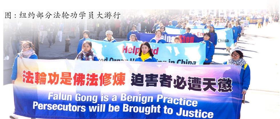
图：纽约部分法轮功学员大游行

智者先贤们都预言了今天正在发生的事，20多年来法轮功学员们善心的告诉您危难时诚念“法轮大法好，真善忍好”保平安，并劝您三退，是真正的在为您生命的未来负责，请莫错过神佛对您的慈悲！请莫错过这万古的机缘！