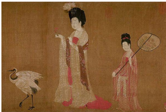
示意图：唐 周昉《簪花仕女图》。

倘若欣赏大唐仕女图，会看到女子的头上戴着硕大的牡丹花，令仕女仪态更显雍华富丽。其实唐朝不只是女子爱花，官员也不例外，甚至有过之而无不及。哪位官员若能得到皇帝御赐的花朵，将其戴在头上，在当时即是莫大的荣耀，有时还会引发其他人的妒嫉呢！