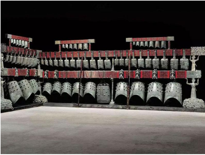
曾侯乙墓出土编钟

我们讲到周公制礼，周公除了制礼他还作了乐，古时人们从天子到诸侯到士都会欣赏音乐，重要的时候比如如国君在宴请诸侯时也会奏乐，在曾侯乙的墓里出土了一组编钟，成为人们研究先秦时音乐的重要文物。