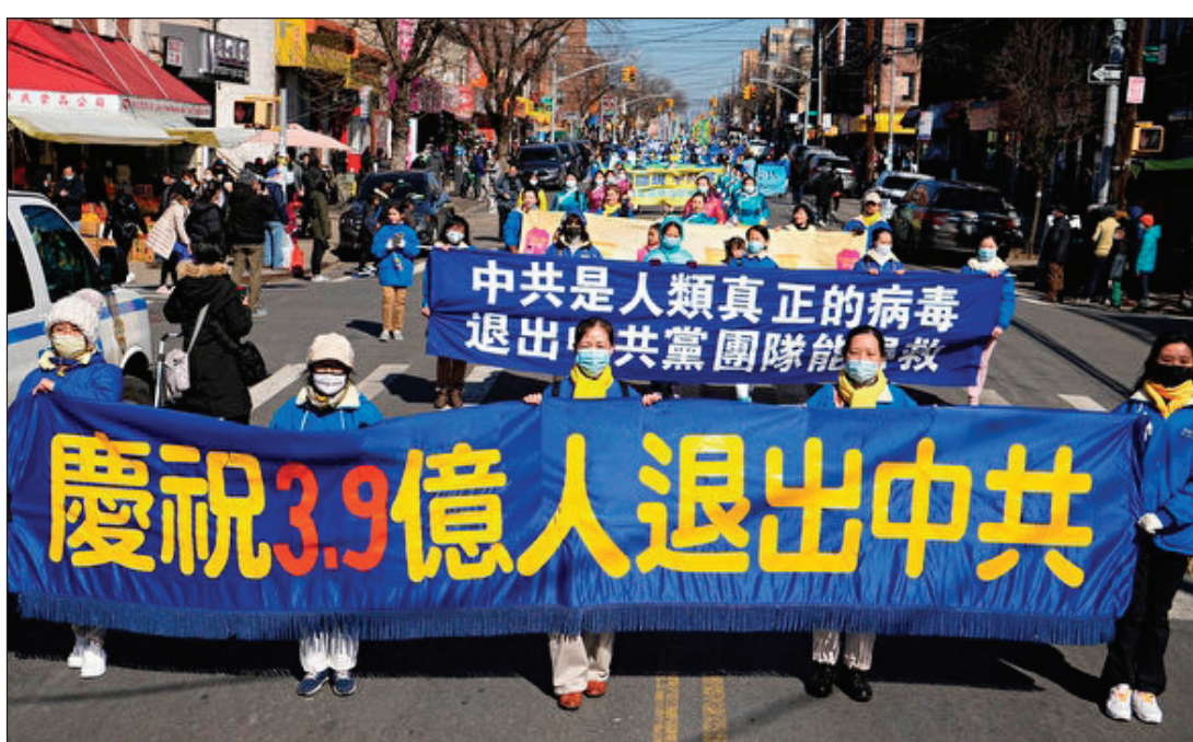
2022年2月27日，纽约法轮功学员在布碌仑8大道游行声援3亿9千万勇士退出中共党团队，声援“打倒中共恶魔”（EndCCP）征签200万。

也许很少有人会联想到大陆居高不下的交通事故，与执政的共产党打击法轮功这个慈悲、平和的修炼团体相关。法轮功是由李洪志先生创造、洪传的佛家上乘功法，他要求修炼者严格按照“真、善、忍”做好人，有5套简单易学的功法。自1992年从吉林长春传出之后，7年时间在神州大地遍地开花，上