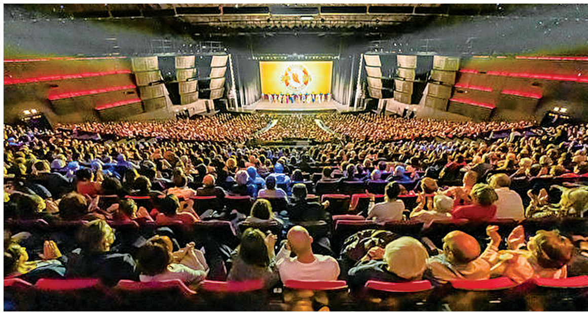
2023 年 2 月 19 日下午，3,700 名观众欣赏了美国神韵纽约艺术团在法国巴黎国际会议中心的第七场也是最后一场演出。

在那里我们确实可以看到一个反思，对当今世界的反思，甚至是对西方社会，但不局限于西方社会的反思，我们必须反思世界的走向了。”