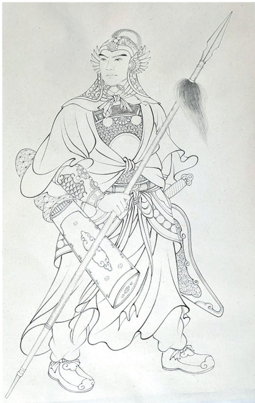
杨六郎（画 / 天外客）

杨业的夫人在听闻丈夫和儿子的噩耗后，悲愤满腔的与六郎杨延昭一同上殿告御状，请求皇上将陷害忠良的潘仁美处斩。然而此时潘仁美早已得知杨延昭回京势必告状