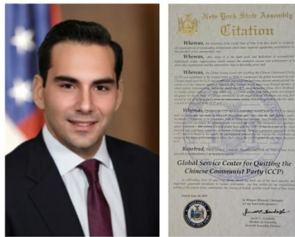
▲ 纽约州州众议员甘道夫和褒奖令

甘道夫说：“在共产中国，一个中国人从童年到中学、高中和大学，就可能已经加入并宣誓效忠于中国共产主义的青年组织以及共产党，如果不加入，这个人可能就面临被主流社会排斥的风险。而当他们加入宣誓时，不是对中国这个国家，而是对中国共产党宣誓效忠。全球退出中共服务中心于二零零四年在美国成立。该组织在全球范围协调退出中共的运动，帮助中国人退出中共及其附属组织，并且帮助世界各地的人们了解共产主义的罪恶本质。中国人在中国共产党统治下，经历了几十年的精神控制、洗脑和恐怖。”