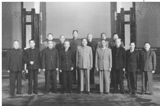
▲ 1955年6月，越共党魁胡志明来中国，毛泽东在人民大会堂与他合影留念。

中共收买亚非拉，一方面是为了拉选票，如果没有这些小国支持，中共会显得很孤单；中共