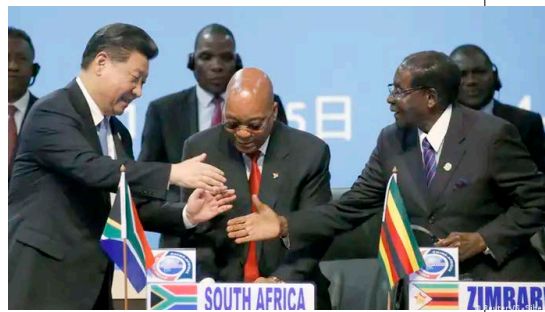
▲ 2015 年，习近平赴南非参加中非合作论坛。