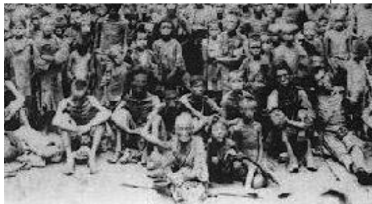
▲ 造成饿死数千万人的三年大饥荒。

1962 年初, 中国承诺对外援助 69 亿多元人民币, 主要是越南、朝鲜、蒙古、阿尔巴尼亚, 其次是柬埔寨、老挝、巴基斯坦、尼泊尔、埃及、马里、叙利亚、