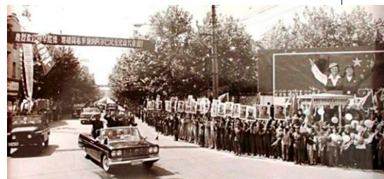
▲ 阿总理穆罕默德·谢胡1966年访华时，中方安排首都北京百万群众夹道欢迎，盛况空前。