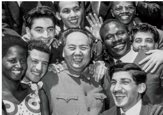
▲ 1959 年毛泽东与亚非拉美青年在一起。