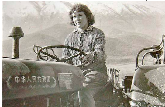
▲中国给老朋友阿尔巴尼亚的新礼物——拖拉机。