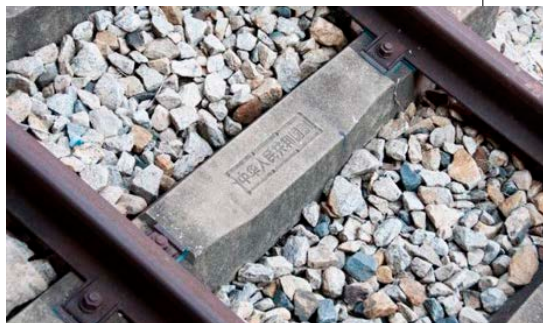
▲坦赞铁路枕木上的“中华人民共和国制”仍然清晰可辨。