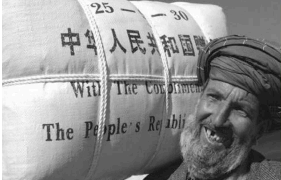
▲ 1961 年 1 月, 中国给了阿尔巴尼亚 5 亿卢布; 1962 年, 还将用外汇从加拿大购进的小麦, 转送给了阿尔巴尼亚。这一切都发生在大饥荒时期。

了他 6 千万美金的“贷款”, 周恩来特别告诉格瓦拉, 这钱“可以经过谈判不还”。