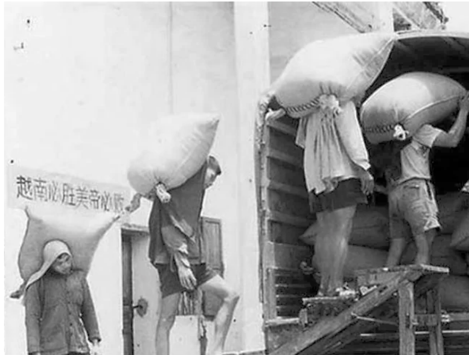
▲ 中国为越共无偿提供大量援助持续了几十年。