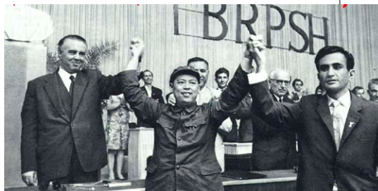
▲ 1967年9月，姚文元率队访问阿尔巴尼亚。