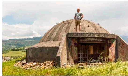
▲ 阿尔巴尼亚全国有780,920个掩体，由于采用了中国最好的材料，坚固程度超出了很多人的想象。

因为援助东西太多，阿尔巴尼亚出现了严重的浪费现象。中国从外国进口的优质钢材（制造