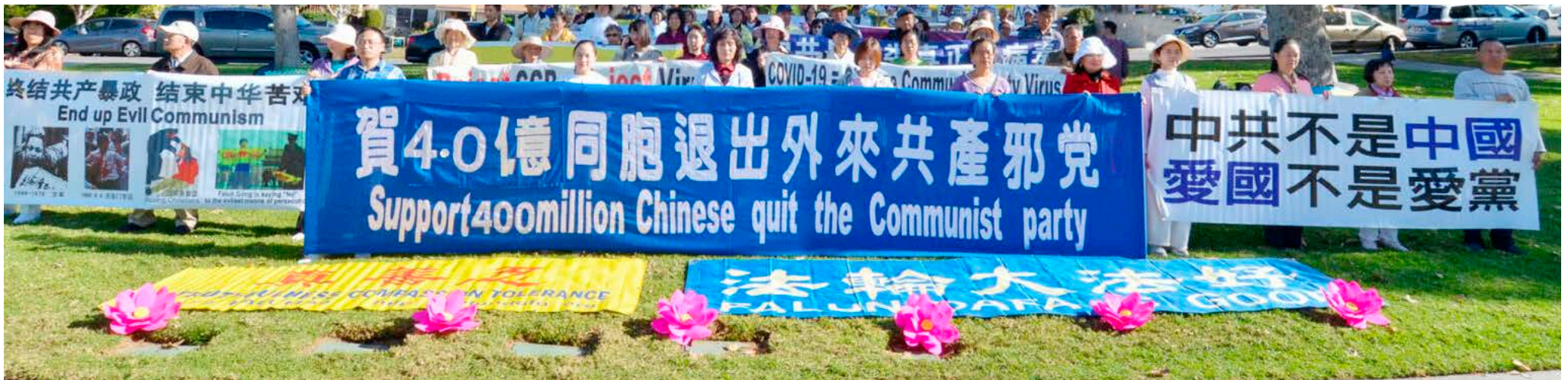
▼ 2022 年 11 月 27 日，近百名法轮功学员在洛杉矶县蒙特利公园市 (Monterey Park) 的巴恩斯公园 (Barnes Park) 集体炼功，并庆祝全球 4 亿 500 万人“三退”（“三退”是指退党、退团、退队）。

唯有认清这一附着在中华民族身上的邪灵梦魇，从内心彻底否定它，中国人民才能摆脱中共流氓的控制，中华民族才能走向真正的繁荣和富强。🕉