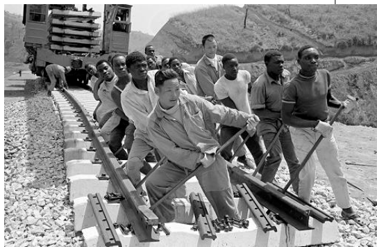
▲在中国的援助下，坦赞铁路开工。图为中、坦、赞三国工人一起劳动的资料照片。

类似这样“打肿脸充胖子”式的援助，还有平壤地铁、丹东新鸭绿江大桥、蒙古纵贯铁路、