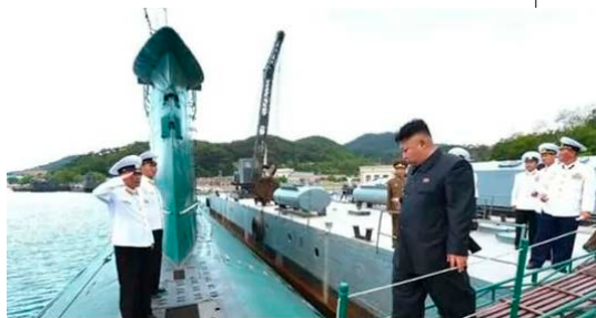
▲ 朝鲜目前最先进的 22 艘罗密欧级常规潜艇，基本都是中国援助或者提供零件由朝鲜组装的。时至今日，它们仍然是朝鲜潜艇部队的主要力量。