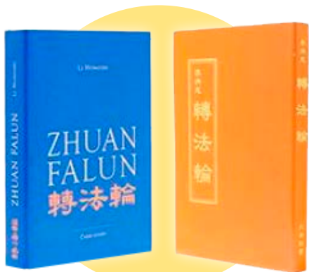
▲《转法轮》是指导法轮大法弟子修炼的主要书籍，此书在全球已被译为 40 多种语言。

他说：“能够做对人类有重要意义的事情，能够打造美好的事物，能够以某种方式帮助人，让我感到充实和满足。”（选自大纪元）◎