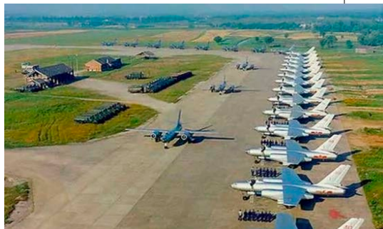
▲ 朝鲜空军至少 1/3 的飞机是中国援助的，其中 107 架歼 5、159 架歼 6、40 架歼 7、80 架轰 5。其中轰 5 在当时是中国主力战术轰炸机，歼 7 更是最先进的战斗机。