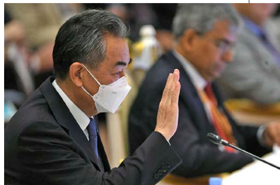
▲ 2022 年，中共国务委员兼外交部长王毅，在中非合作论坛第八届部长级会议成果落实协调人会议上发表影片致词，提到中方将免除非洲 17 国截至 2021 年年底对华到期的免息贷款债务 23 笔。