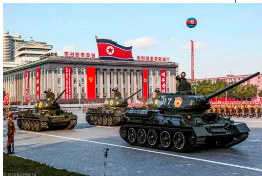
▲ 朝鲜的 T34 坦克，都是当年志愿军留下的。

根据中共军方数据，中共抗美援朝军费惊人，支出达63亿元人民币，几乎是中国1950年全年财政收入的总额。抗美援朝还使中国背负了巨大的债务，欠下苏联44亿卢布的（抗美援朝）贷款。