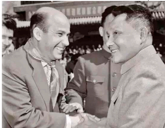
▲ 1963年5月1日，邓小平在北京会见来访的阿尔巴尼亚青年代表团。