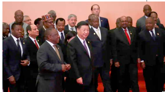
▲ 2018 年，中共领导人习近平和非洲各国领导人在中非合作论坛北京峰会上。