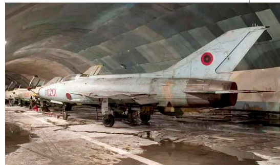
▲ 阿尔巴尼亚是欧洲唯一一个装备歼-7战斗机的国家，1970年，中国曾向阿尔巴尼亚无偿援助了12架歼-7战斗机，而当时其它欧洲国家装备的则是苏联制造的米格-21。