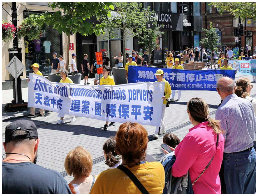
◀ 2023年7月至8月，世界各地法轮功学员举行720反迫害游行活动，向过往民众揭露中共邪恶的真面目，并悼念被中共迫害致死的众多法轮功学员，声援4.1亿人退出中共相关组织。图为各地游行活动中展示出的众多横幅。