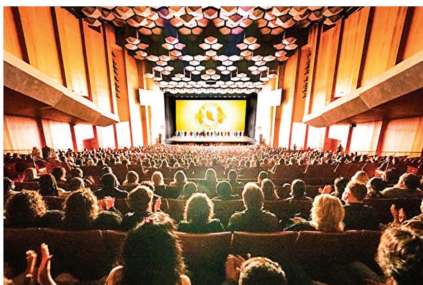
2023年12月31日下午，神韵北美艺术团在美国德州休斯顿琼斯演艺中心第八场演出的谢幕照。

神韵今年有八个团在全球巡回演出，其致力于恢复中国传统文化的成就让她非常敬佩。她表示，这