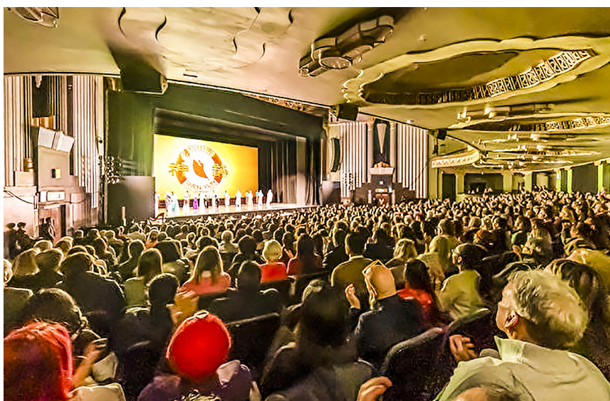
2024 年 1 月 28 日下午，神韵新纪元艺术团在伦敦汉默史密斯阿波罗剧院的演出持续爆满。图为谢慕照。

美术学院毕业的陈女士，特别对神韵舞台的色彩倍加赞赏，“神韵舞台明亮的色彩，我觉得她传递的就是那种有宗教信仰方面的那种神学的美，那种慈爱的那种美，好像