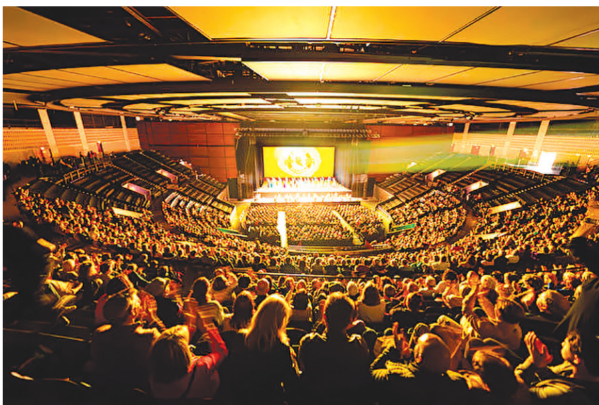
2024年3月29日下午，神韵新纪元艺术团在法国士伦泽尼特剧场的第四场演出，全场大爆满。图为演出结束后，神韵艺术家们向观众谢幕。

“乐声几乎就像她的内心，她在表达自己。从中你以一种新的方式看到了众多中国人的内心。在加拿大，我们不太了解中国人的内心，但我觉得神韵，尤其是二胡演奏，让我们对中国的细腻和温柔有了新的认识。” “这是我们在加拿大很少感受到的，但神韵确实道出了共产主义之前的中国人的心声。”他说，“很多人只是通过共产主义，通过中国共产党，认识中国人，而中共，那