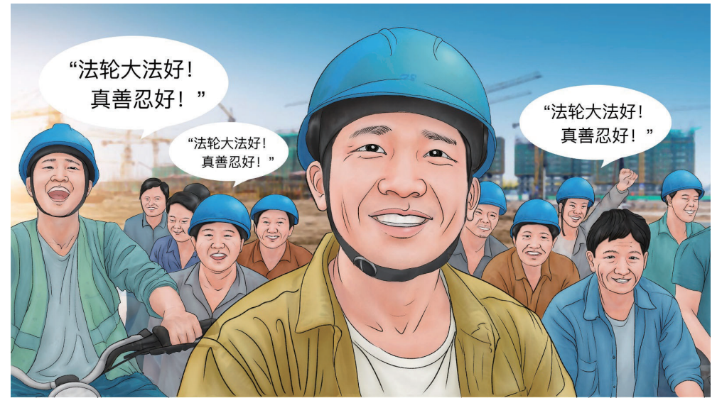
3 从此以后“法轮大法好！真善忍好！”常常在工地上响起。