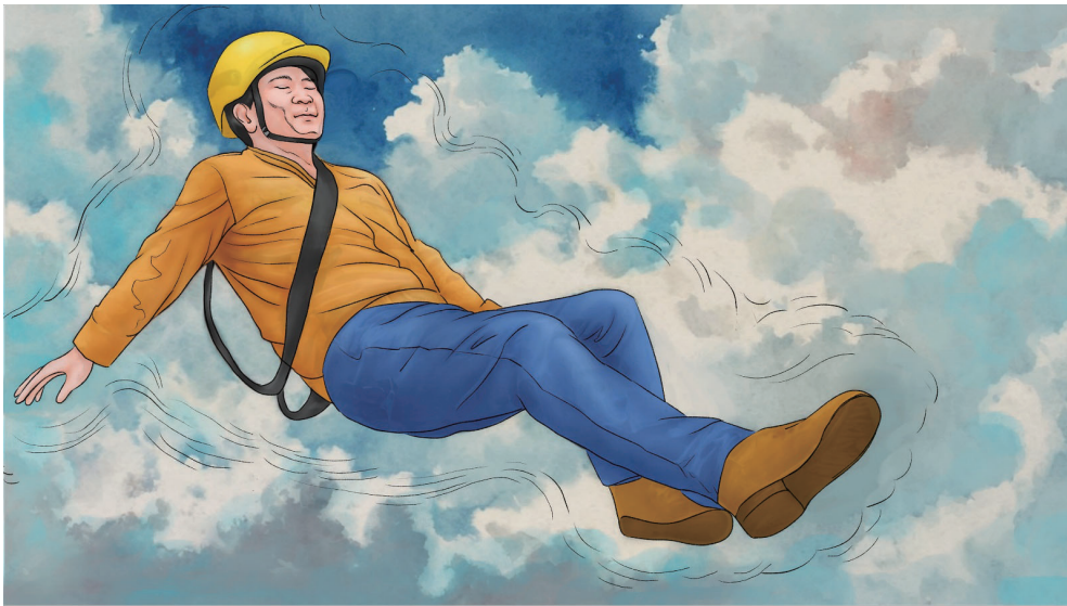
6 他经常念，“法轮大法好，真善忍好”。生死关头是大法师父保护了他。他还告诉大家他摔下来时感到身体周围有一团热气包裹着他，落到地上时盘着腿就象坐在一团棉花上一样，一点疼的感觉都没有。