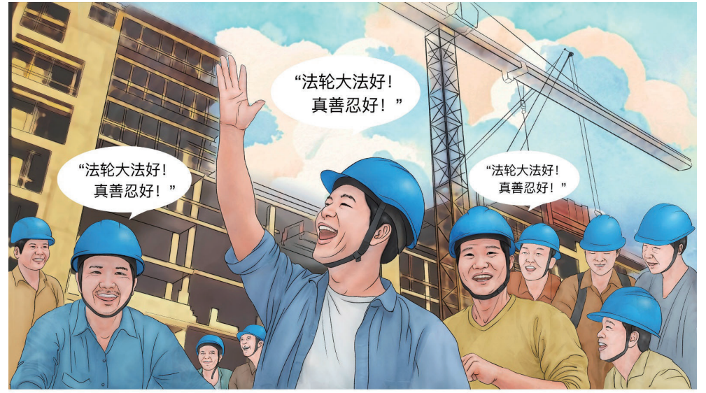
7 由于民工们目睹了大法的神奇，从此他们都跟着念：“法轮大法好！真善忍好！”，同时把劳动时的口号也喊成了“法轮大法好！真善忍好！”