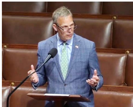
▲ 国会众议员佩里在投票前发言。

美国国会认为，通过非自愿的器官摘取来杀人，严重违反了普世的医学伦理标准，直接违背了人类