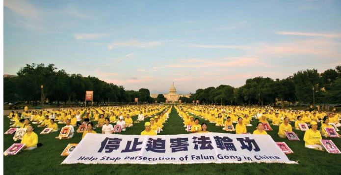
图：2024 年 7 月 11 日晚，法轮功学员在美国首都华盛顿举行烛光悼念，呼吁立即停止迫害法轮功。

全部根据明慧网的报道整理。美国国务院官员几年前即告知，法轮功学员提供的材料是确凿可信的、呈现的方式是专业的。