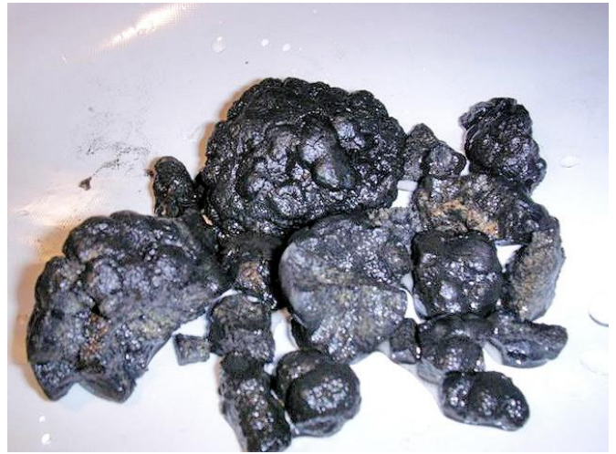
▲ 多金属结核 (polymetallic nodules)。

海水可以透过 1.5 伏特的电力分解为氢气和氧气，这个电量相当于一颗 AA 电池。研究者发现，某些结核的电力高达 0.95 伏特，而多个结核组合在一起则能产生更高的电压。