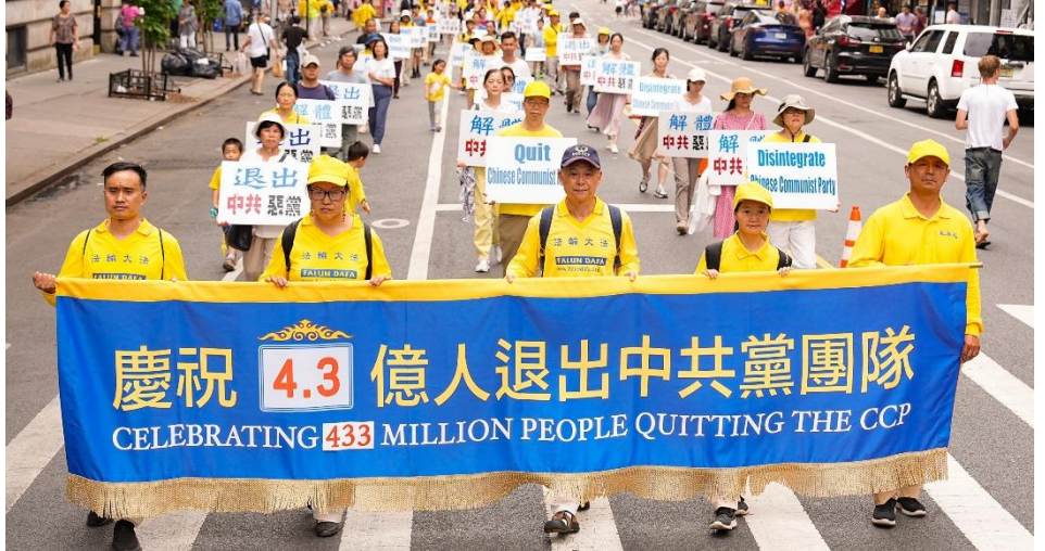
图：2024 年 7 月 20 日法轮功学员在美国曼哈顿华埠举行游行，纪念法轮功反迫害 25 周年及声援 4.3 亿中国人退出中共党团队组织。

“哦”，男人似乎想了起来，我又问他们：“知道马克思是什么样的人吗？”他们摇头表示不知道，我告诉他们：“马克思是邪教的人，撒旦