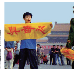
迫害法轮功 至少 5120 人被害死 (1999 年至现在)

1999 年 7 月 20 日到 2019 年 7 月 10 日，这二十年来，在中国大陆里被中共抓捕的法轮功学员总人次（一人多次被抓算多次）至少为 250 万到 300 万。”“更有成百万、上千万为不牵连家庭、邻里、工作单位而隐姓埋名为法轮功上访的法轮功学员被抓捕并转移到秘密集中营，成为中共的活体实验对象、以及器官移植的活体供源、残缺的遗体被就地火化；这部分受害者的名单和详细案情暂时还无法列入上述统计。”