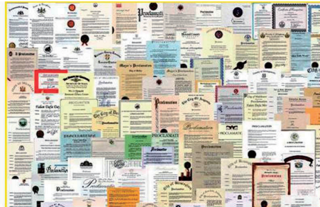
图：法轮功获各国政府褒奖、支持议案和信函5000多项。上图是来自世界各国的部分褒奖。