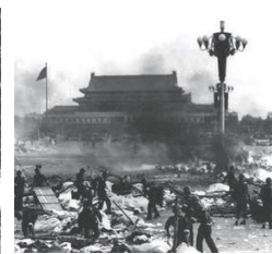
六·四 约 3000 人死亡 (1989)