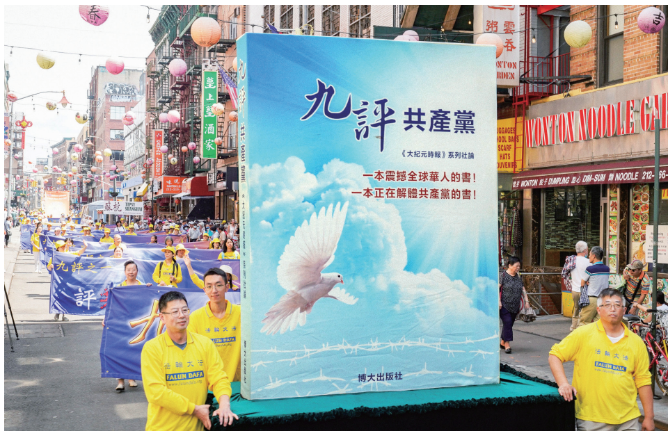
图：2023年7月15日美国纽约法轮功学员举行盛大游行，声援4.15亿中国人退出中共党团组织。