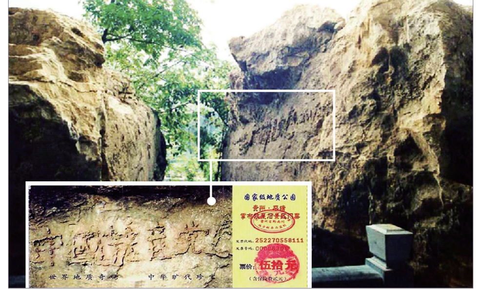
图：“藏字石”断面上呈现出的“中国共产党亡”六个大字清晰可辨，昭示着“天灭中共”的天意。小图是风景区的门票。

4月25日当晚，江泽民强行推翻政府总理的开明决定，把和平上访歪曲成“围攻中南海”，并于1999年7月开始全面迫害法轮功。◇