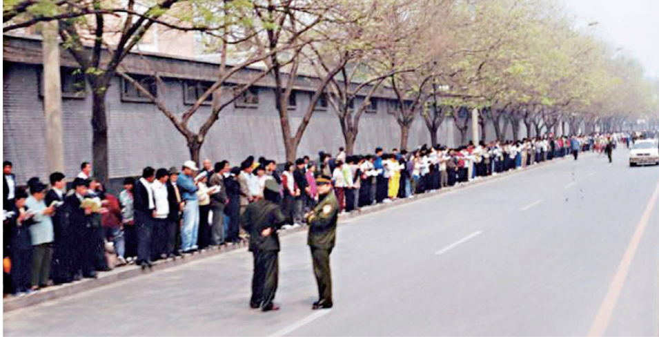
图：1999年4月25日上访现场，法轮功学员文明安静，警察不用维持秩序，在一旁聊天。所谓的“围攻中南海”根本就不存在。