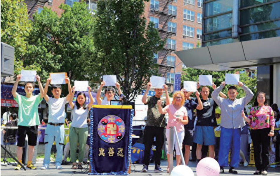
图：2022年8月3日，全球退出中共党团队人数突破4亿，在美国纽约集会庆祝时，华人在集会上公开退出中共党团队。