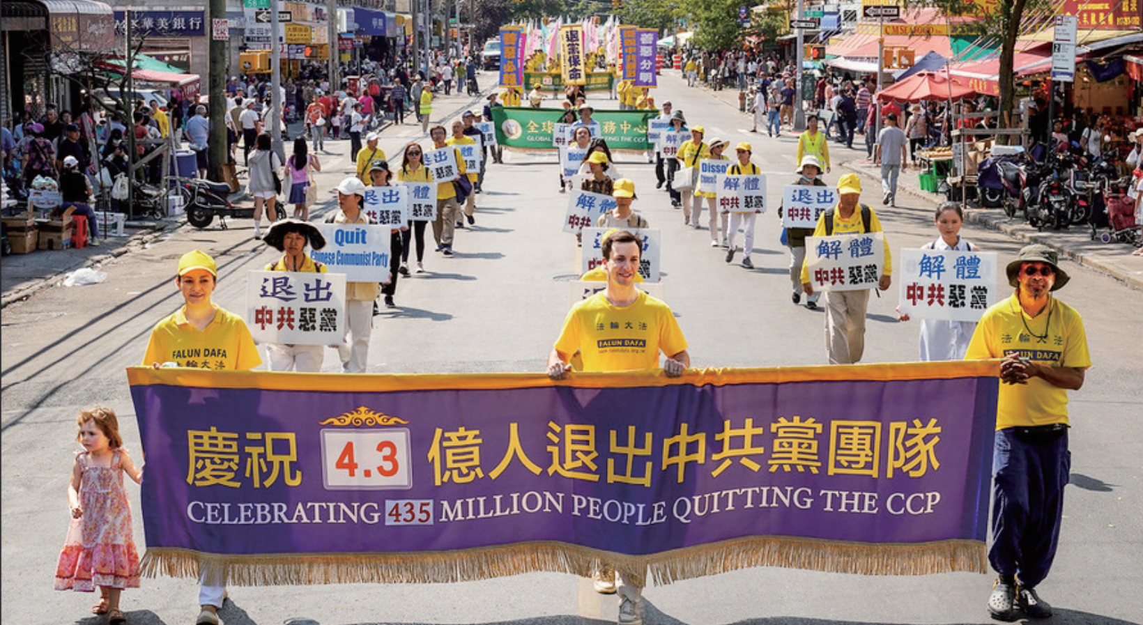
图：2024年9月14日，美国纽约布鲁克林大游行中，声援4.3亿中国民众退出中共的游行队伍。