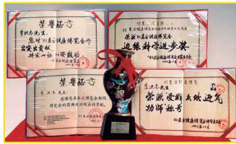
图：1993年北京东方健康博览会上，李洪志先生荣获博览会最高奖项“边缘科学进步奖”。

“真善忍”的信仰得到了世界各族裔民众的爱戴和尊敬，却在中国大陆一地受到残酷迫害。◇