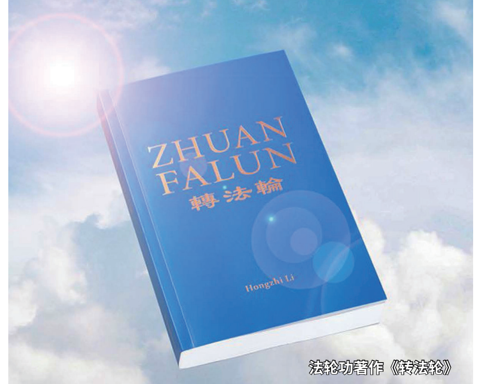
法轮功著作《转法轮》

对中共的彻底失望，促使我下决心，砸掉“铁饭碗”，凭自己的本事来养家糊口。于是我写了离职报告，要求离开政界，在回访莫斯科母校时搞了中苏合资公司，我在合资公司任职，常驻莫斯科。