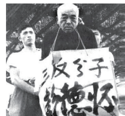
文革 773 万人死亡 (1966-1976)