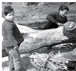
大跃进 饿死 4300 万人 (1959-1961)

诚愿更多的人能够快快找寻真相，能够象法轮功创始人李洪志大师在《为什么会有人类》一文中所说的那样：“所以人生在世无论你的生活贫富，一定要做好事，不做坏事，保持善良，敬天敬神，乐于助人。”◇