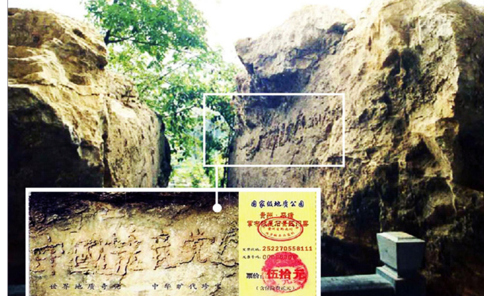
图：“藏字石”断面上呈现出的“中國共產党亡”六个大字清晰可辨，昭示着“天灭中共”的天意。小图是风景区的门票。