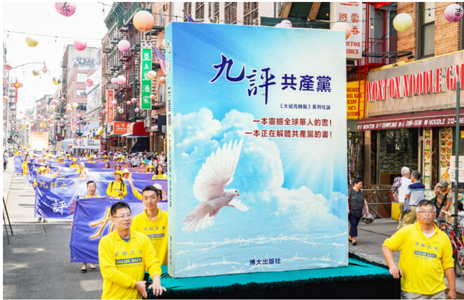
图：2023年7月15日美国纽约法轮功学员举行盛大游行，声援4.15亿中国人退出中共党团组织。