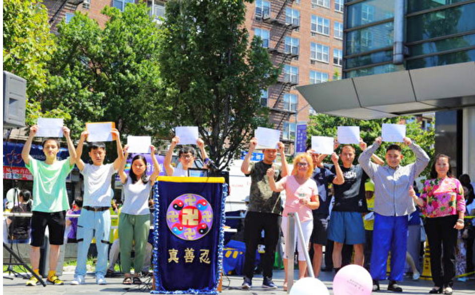
图：2022年8月3日，全球退出中共党团队人数突破4亿，在美国纽约集会庆祝时，华人在集会上公开退出中共党团队。