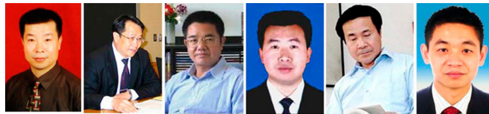
图：近年来，已有上百位正义律师为法轮功学员做上千场无罪辩护。正义律师们从法律角度、信仰角度、法轮功真相角度、甚至政治角度有理有据有力地全面论证“修炼法轮功无罪，传播法轮功真相无罪”。

4月25日当晚，江泽民强行推翻政府总理的开明决定，把和平上访歪曲成“围攻中南海”，并于1999年7月开始全面迫害法轮功。◇