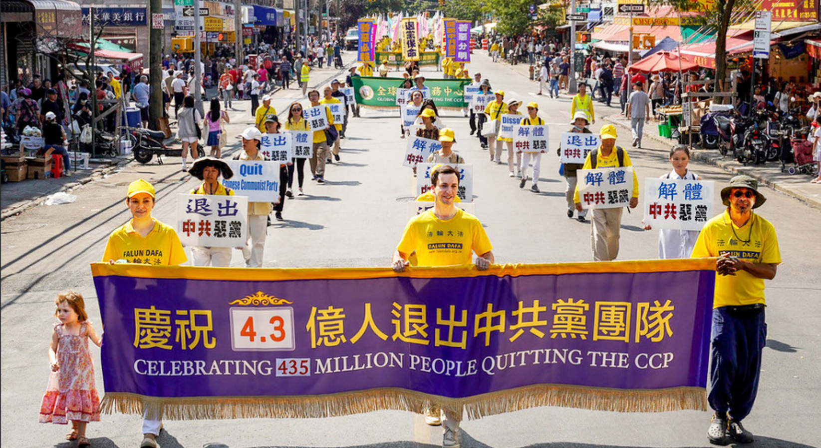
图：2024年9月14日，美国纽约布鲁克林大游行中，声援4.3亿中国民众退出中共的游行队伍。