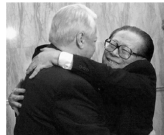
图：1999年12月江泽民在北京会见叶利钦。

在其它边界划分的主权问题上，由于对中共保持政权没有什么利益，所以中共根本不在乎，只是在自身执政遇到危机时才拿来炒作、煽动所谓的“爱国主义”，其实只是转移内部矛盾的烟幕弹而已。◇