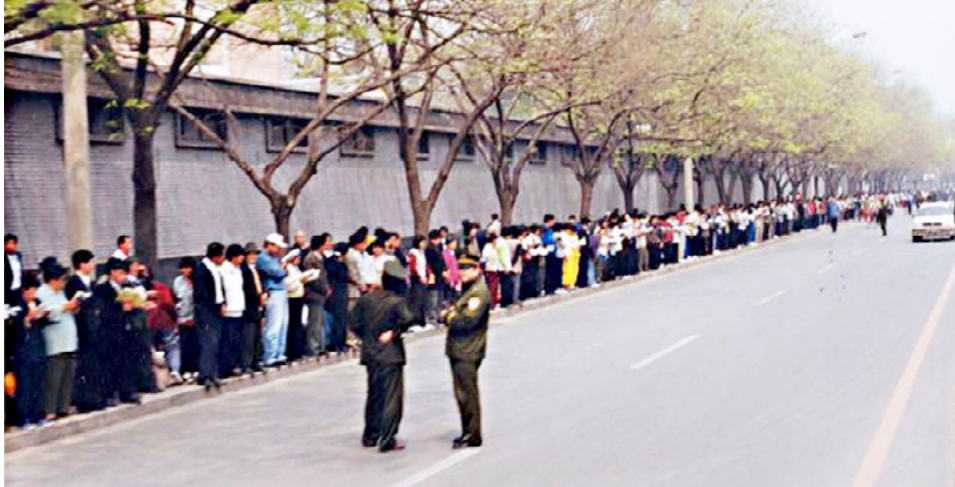
图：1999年4月25日上访现场，法轮功学员文明安静，警察不用维持秩序，在一旁聊天。所谓的“围攻中南海”根本就不存在。