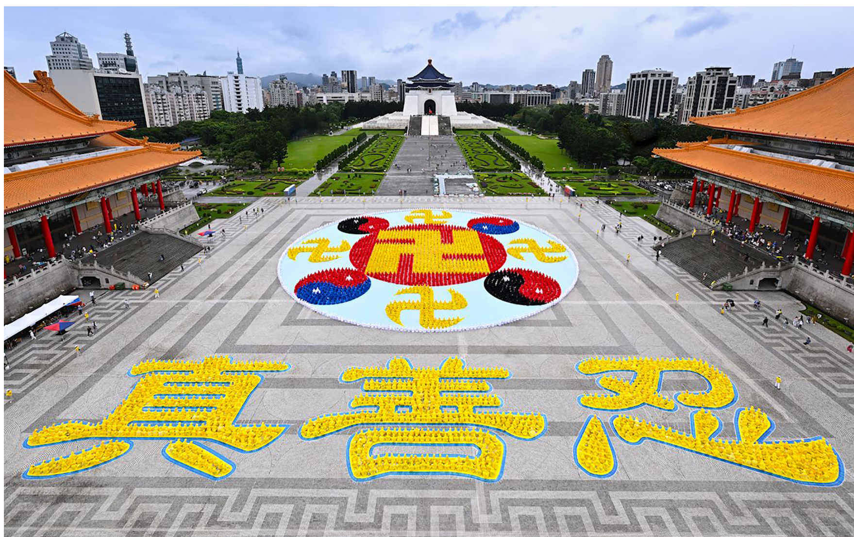
2024年11月17日，约五千两百名法轮功学员在台北自由广场排字。