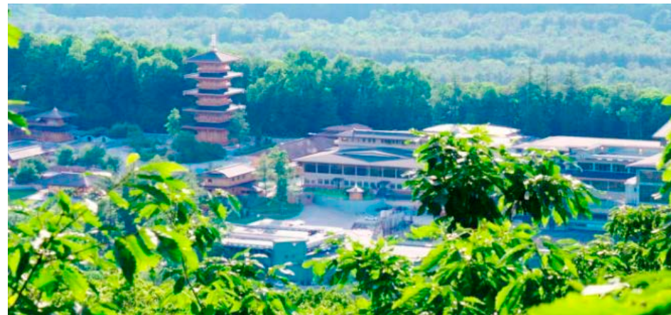
▼ 龙泉寺在距纽约市近两个小时车程的地方，森林茂密的沙旺克山北麓，占地 160 公顷。

李先生还跟记者说：“我没有钱，也没有房产，也没有车，我所有的收入就是我书籍的一点稿费。我住的地方就在庙区（龙泉寺）一个宿舍里，我的房间里有床、书架，没有任何高档的家具。”