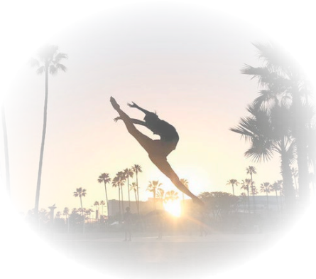
▲2016年全球巡演路上，王琛在洛杉矶长滩会展娱乐中心露台剧院外腾空而起。

希望自己可以一直跳舞，跳下去，能跳多久，跳多久。”相信这也是世界各地喜爱王琛的观众们的共同心愿！（资料来源：正见网、神韵官网）◎