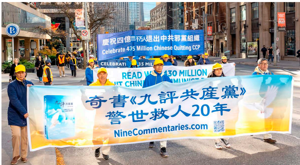
▲ 2024年11月2日，多伦多市民和部分法轮功学员在市中心举行集会、游行活动，以庆祝《九评共产党》发表20周年。