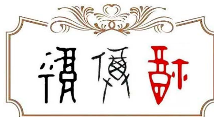
▲ 福，甲骨文字形示意图

迎春送“福”，开门见“福”，拜年祝“福”。“福”字表示福气、福分、福祉、福德、福慧、福运，等等。在新的一年里到来之际，“福”传递着美好的祝愿与希望。