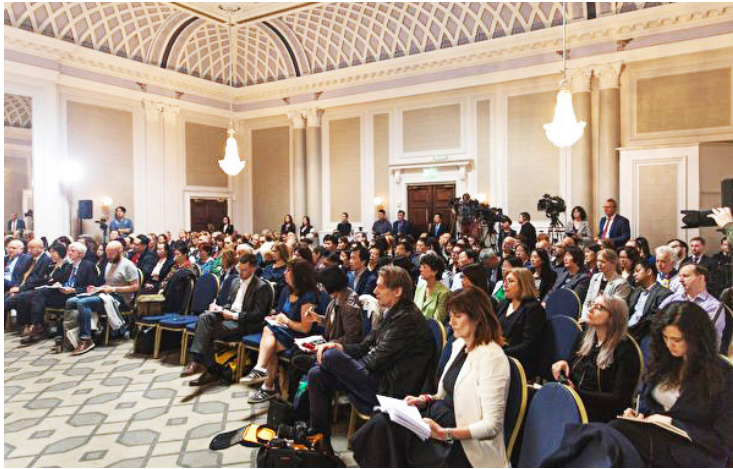
图：2019年6月17日，“独立法庭”在英国伦敦宣判，当日法庭内聚集了约200名旁听民众及记者。

● 2016年6月13日，美国国会众议院全体通过343号决议案。该决议案要求中共立即停止针对法轮功学员和其他良心犯的“活摘器官”罪行，并要求进行可信、透明和独立的调查。