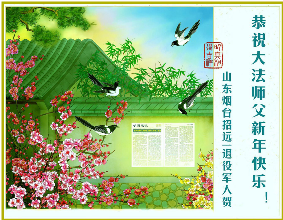
图：山东烟台招远一退役军人恭祝大法师父新年快乐！