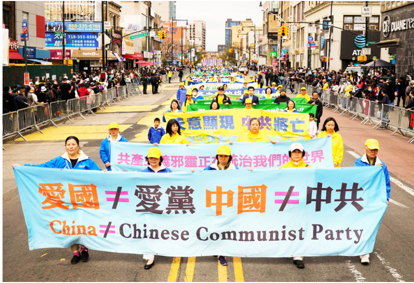
爱国不等于爱党 中国不等于中共