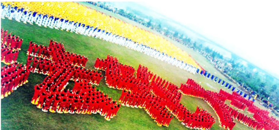
图：1999年3月27日，近万名法轮功学员在武汉汉水公园炼功排字，展现了在中共迫害开始前法轮功在中国大陆弘传的盛况。

● 1998年，中国国家体育总局在北京、武汉、广东等地做了五次医学调查，显示法轮功祛病健身的有效率高达98%。