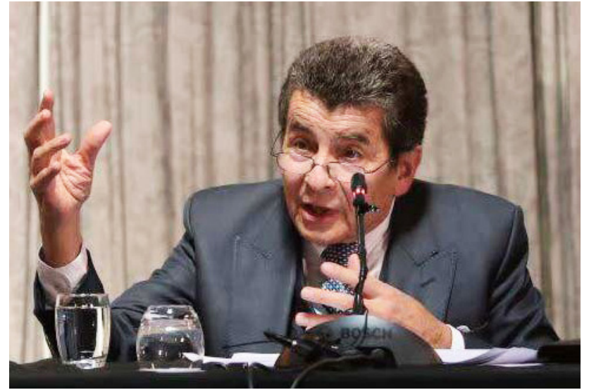
杰弗里·尼斯爵士 (Sir Geoffrey Nice)