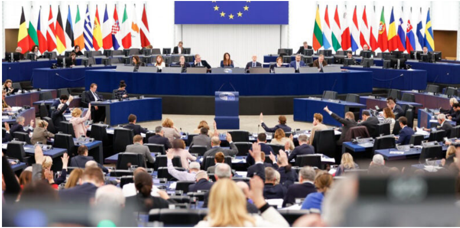
图：2024年1月18日中午，欧洲议会议员全体大会表决通过谴责中共迫害法轮功的决议。