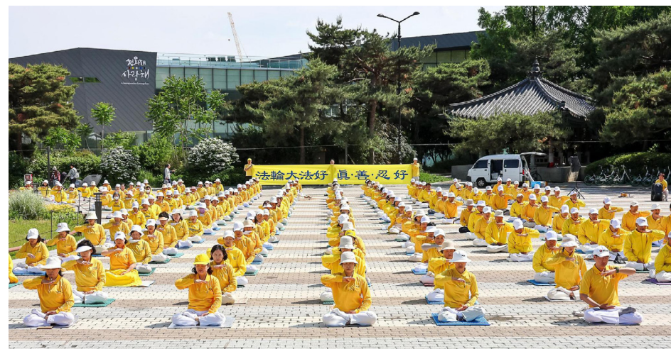
▽ 2024年5月12日韩国首尔法轮功学员在青瓦台前集体炼功。