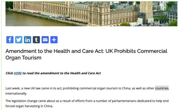
图：2022年4月底，一项新的英国法律——《健康和护理法案》（the Health and Care Bill）正式生效。

捷克、葡萄牙、摩尔多瓦、阿尔巴尼亚、挪威、瑞士、马耳他、拉脱维亚、哥斯达黎加、克罗地亚、斯洛文尼亚、黑山、比利时和法国相继签署《反对人体器官贩运公约》，并批准生效。