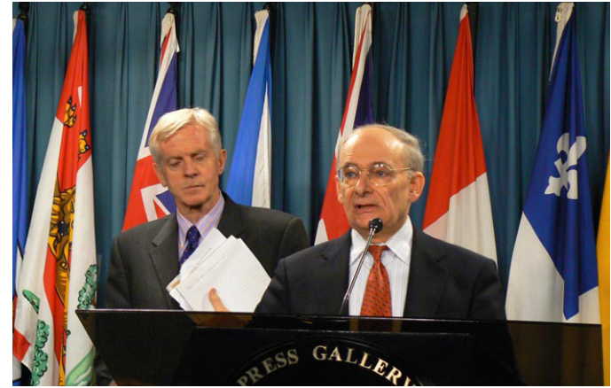
图：2006年7月6日麦塔斯（讲话者）和乔高在新闻发布会上。公开了“关于调查指控中共摘取法轮功学员器官的报告”。