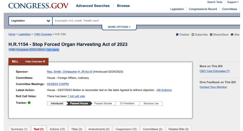
图：2023年3月27日，美国联邦众议院通过了《2023年制止活摘器官法案》（亦称：H.R.1154号法案）。（美国国会网络截图）。

中共大规模活摘法轮功学员器官的罪行越来越引起国际社会的广泛关注，全球多个国家相继立法，阻止本国公民去