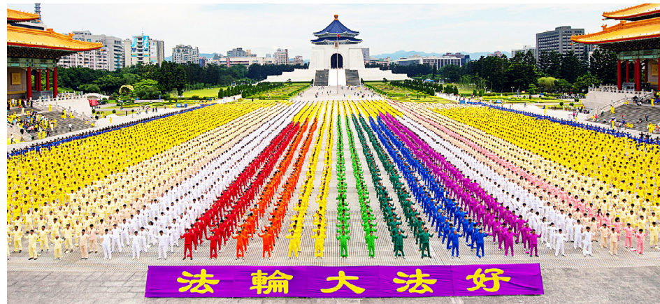
△ 2012年4月29日，台湾自由广场七千多名法轮功学员集体炼功。

目前，法轮大法已弘传全球一百多个国家和地区，受到世界各地民众的喜爱。法轮大法主要著作《转法轮》等被翻译成五十种语言，并可在法轮大法网站上免费下载。◇