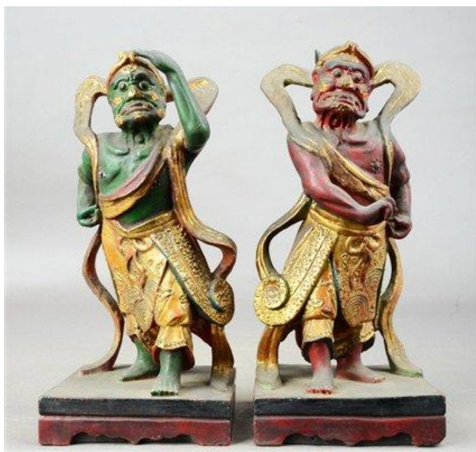
▲ 千里眼顺风耳像，清朝时期木雕，藏于国立台湾历史博物馆。

玉鼎真人告诉杨戩，高明高觉其实是棋盘山上的桃精和柳鬼，桃、柳二怪盘根三十里，采天地之灵气，