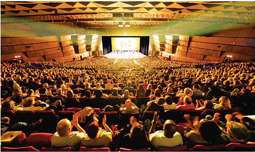
2025年4月19日，神韵纽约艺术团在巴黎国际会议中心上演两场演出爆满。图为当天晚上场演出的场面。

加拿大国会议员Shuvaloy Majumdar先生已数度观看神韵，4月15日晚，在卡尔加里金禧剧院再度观赏神韵演出后，他表示，当晚的演出再次提醒了他，“中共对道德信仰的迫害已经持续了超过四分之一个世纪”，“过去二十多年来，中共当局一直在打压各种信仰团体，包括法轮大法，这是错误的。人们应该拥有他们与生俱来、刻在心中的自由，自由地去信仰他们希望