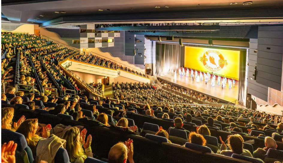
图：2026 年 1 月 2 日，美国神韵环球艺术团在英国伯明翰 IC（The ICC Birmingham-Hall 1）音乐厅的首场演出爆满。