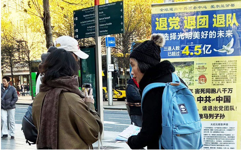
图：华人在爱尔兰都柏林的市中心真相点了解真相。