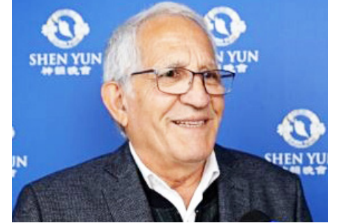
图：法国阿米雷市市长马塞尔·莫伊纳德在波尔多观看神韵。