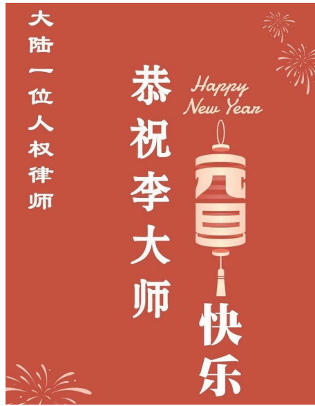
图：中国大陆人权律师祝李大师 2026 年元旦快乐！