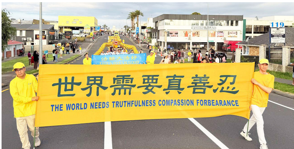
图：2025 年 12 月 10 日由法轮功学员组成的天国乐团、舞龙队和腰鼓队参加了奥克兰帕帕图伊图伊（Papatoetoe）区圣诞游行。