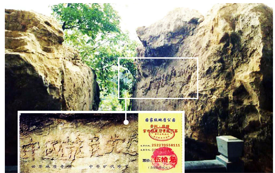
图：2002 年 6 月在贵州发现的“藏字石”断面上显现“中国共产党亡”六个大字，昭示着“天灭中共”的天意。