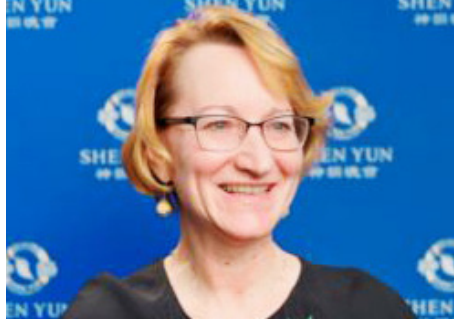
图：拉脱维亚教育与科学部长达斯·梅尔巴德在里加观看神韵。