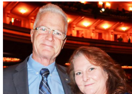
图：美国普莱森顿市议员克雷格·艾歇尔与太太在旧金山观赏演出。