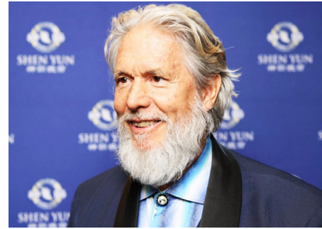
图：2026年3月26日，物理学家麦可·波拉佐在美国加州首府沙加缅度观赏了神韵演出。