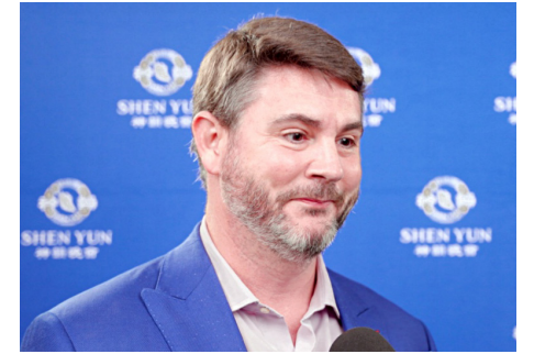
图：2026年3月25日晚，美国畅销书作家詹姆斯·林赛博士在纽约市观赏了神韵演出。