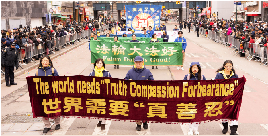
图：2026年2月21日丙午马年大年初五，法轮功学员参加纽约法拉盛中国新年游行。