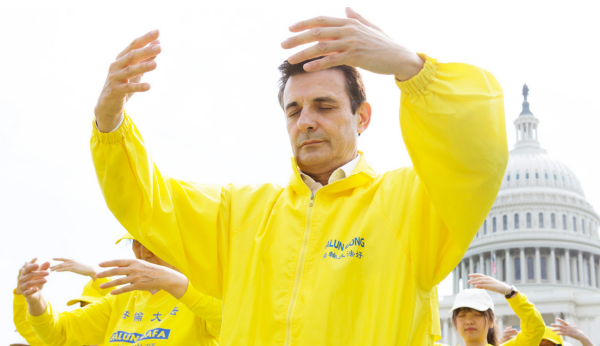
< 2018年6月20日，数千名法轮功学员在美国国会西草坪上集体炼功。