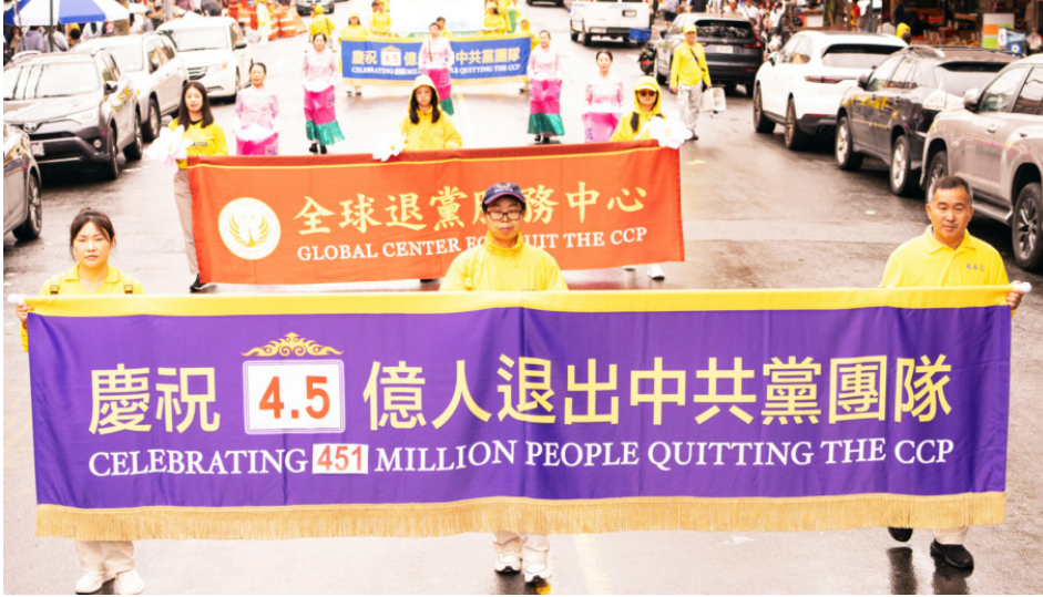
图：2025年9月7日，美国纽约千余法轮功学员在布鲁克林举行盛大游行，声援全球4.5亿勇士三退。