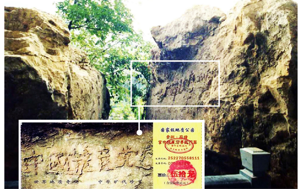
图：2002年6月在贵州发现的“藏字石”断面上显现“中国共产党亡”六个大字，昭示着“天灭中共”的天意。