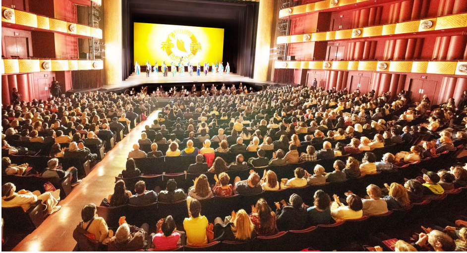
图：2026年3月26日下午，神韵纽约艺术团在纽约市林肯中心大卫·寇克剧院（David H.Koch Theater）举行了今年在该剧院十八场演出的第二场，票房再爆满。