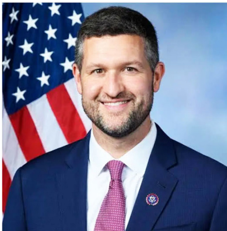
< 纽约州第 18 选区联邦众议员帕特里克·瑞安。