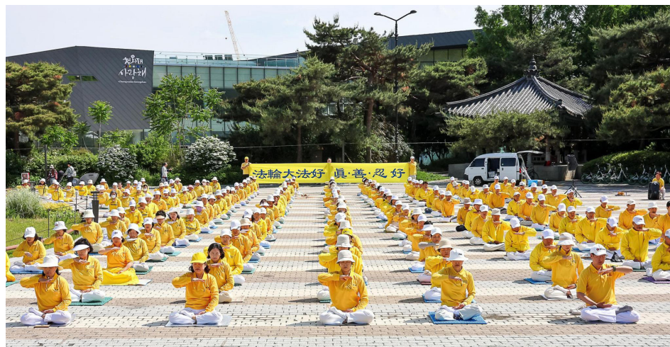
✓ 2024年5月12日韩首尔法轮功学员在青瓦台前集体炼功。