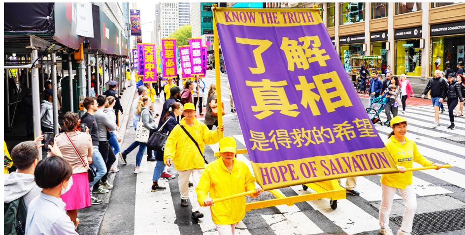
图：2022年5月13日，法轮功学员约四千人在纽约曼哈顿中城最繁华街区举行盛大游行。

●对法轮功的诬蔑来自于江泽民1999年10月25日接受法国《费加罗报》记者采访时说“法轮功就是×教”，以及1999年10月27日《人民