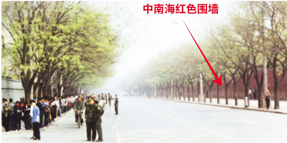
图：1999年4月25日上访现场，和法轮功学员隔街相望的才是中南海的红色围墙，法轮功学员没有“围”住中南海，更没有发生所谓“冲击”事件，所谓“冲击中南海”、“围攻中南海”根本就不存在。