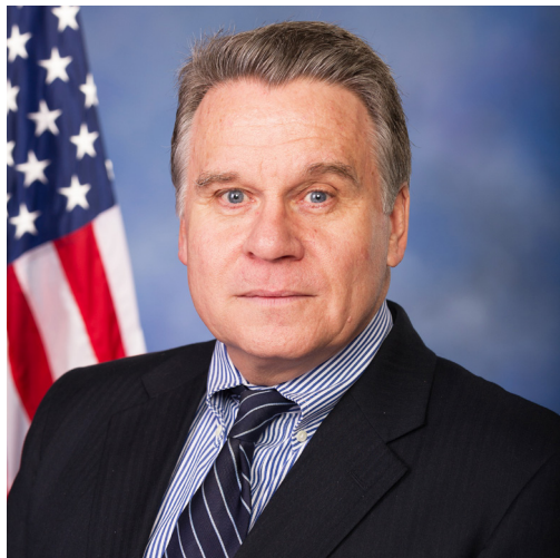
图：美国联邦众议员克里斯·史密斯（Rep. Christopher Smith）