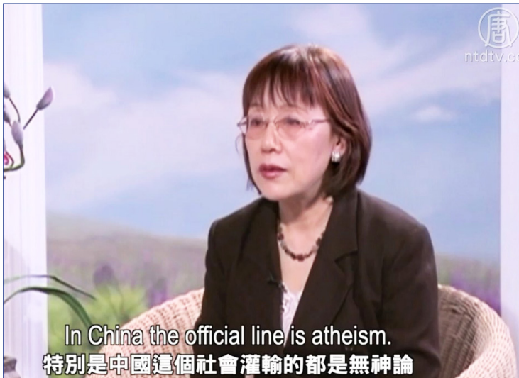
< 张亦洁，中国前对外贸易经济合作部（现更名为中国商务部）官员。