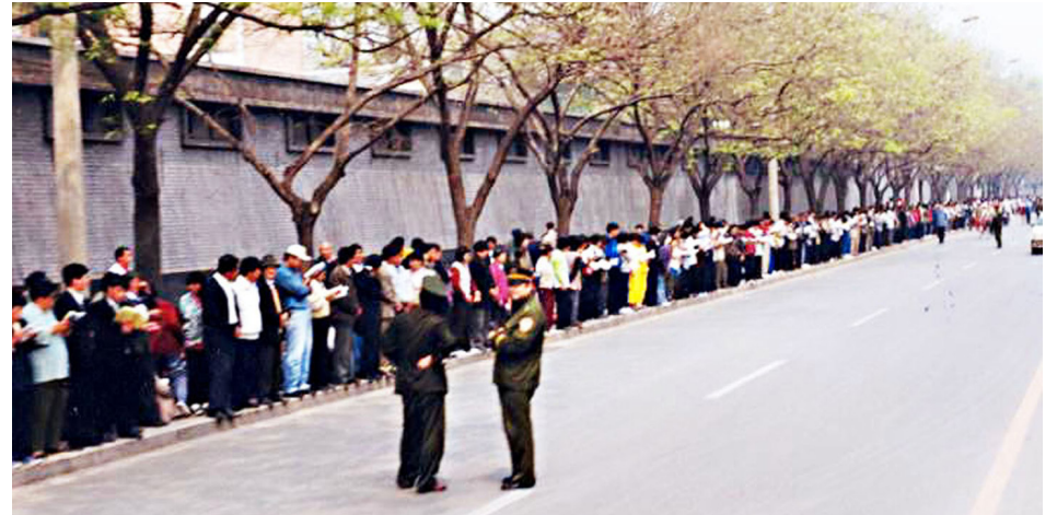
图：1999年4月25日上访现场，法轮功学员静静地站立或看书，警察不用维持秩序，在一旁聊天。法轮功学员没有标语，也没有口号，只是静静地站在那里，只为反映真实情况。

二十多年的时间里，涓涓细流汇成大潮，三退大潮席卷中华，至2026年4月，超过 4.6亿人 在退党网站声明三退。◇