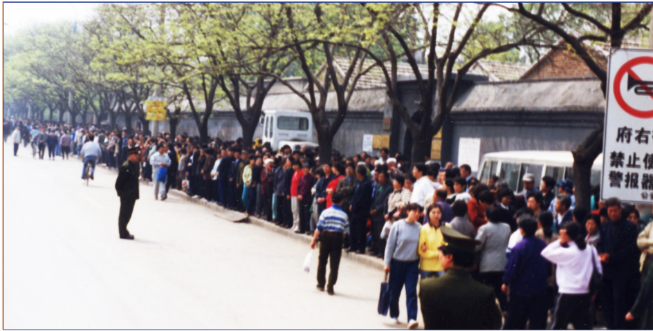
1999年4月25日，站在府右街西侧便道上的上访的法轮功学员。