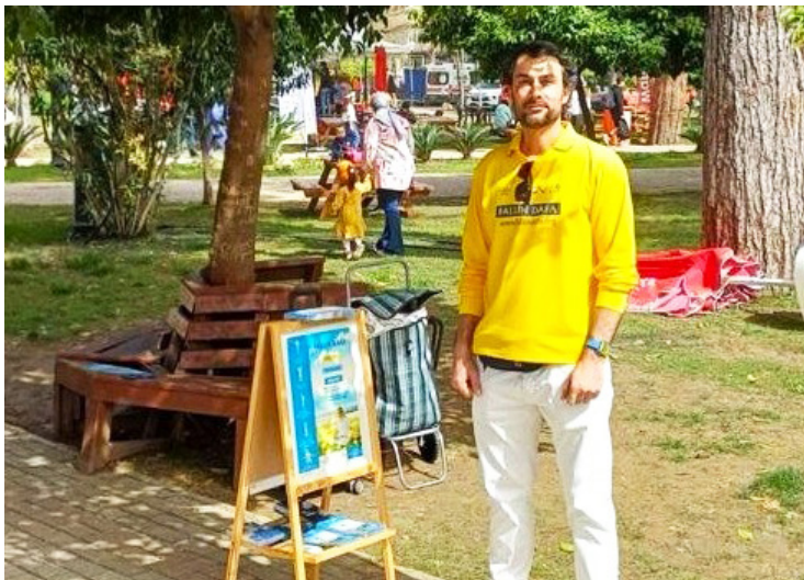
< 艺术家里奥正在参加讲真相活动。