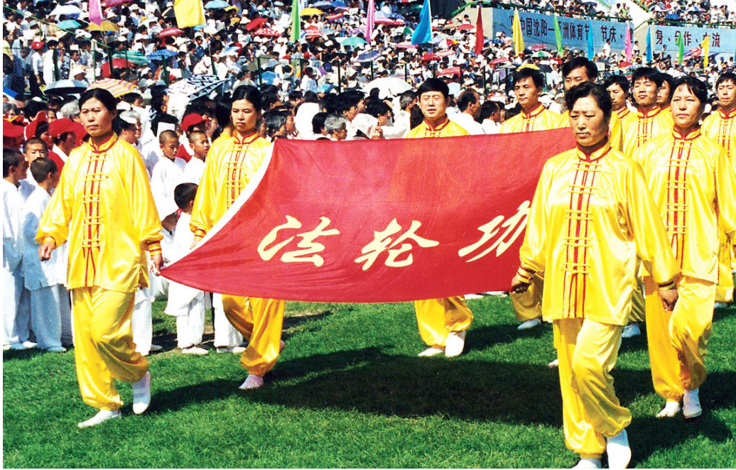
图：1998年8月20日，法轮功队伍在“中国沈阳—亚洲体育节”的开幕式上入场。8月28日，《中国青年报》以《生命的节日》为题介绍体育节上法轮功队伍的良好表现和法轮功的健身效果。