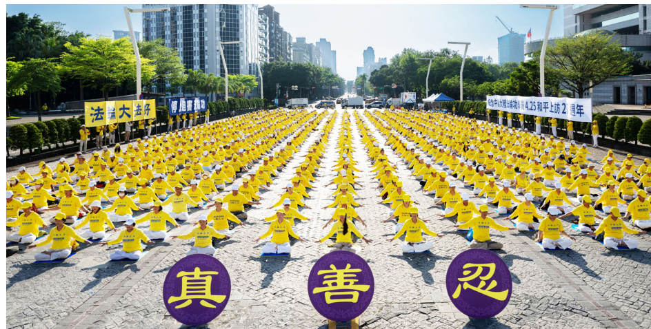
2026年4月19日，法轮功学员在台北市府广场纪念“4·25”和平上访。

●对法轮功的诬蔑来自于江泽民1999年10月25日接受法国《费加罗报》记者采访时说“法轮功就是×教”，以及1999年10月27日《人民