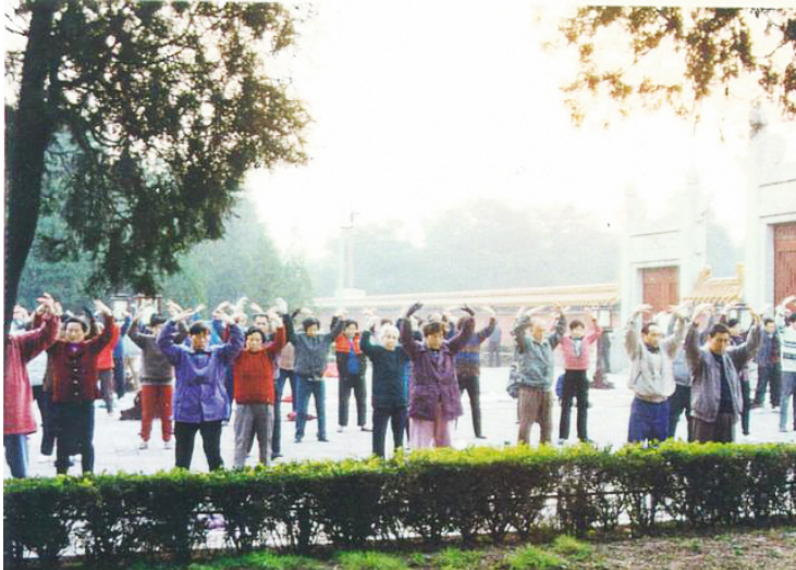
< 1999 年中共迫害法轮功之前，北京法轮功学员在地坛公园集体炼功。

为地位，我已有地位；若为幸福的家，我也已拥有，但在学法轮功前我灵魂就一直感到缺失，觉得人生不该只是这样。金钱买不来健康，名利更是过眼烟云。”