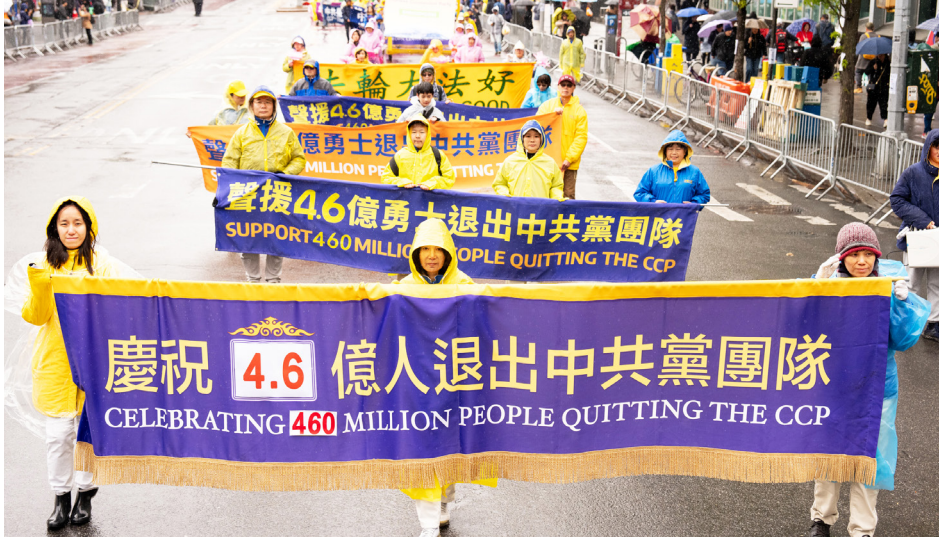
图：2026年4月25日，美国大纽约地区部分法轮功学员在法拉盛举行了盛大的游行活动，纪念“4·25”万人和平上访27周年。