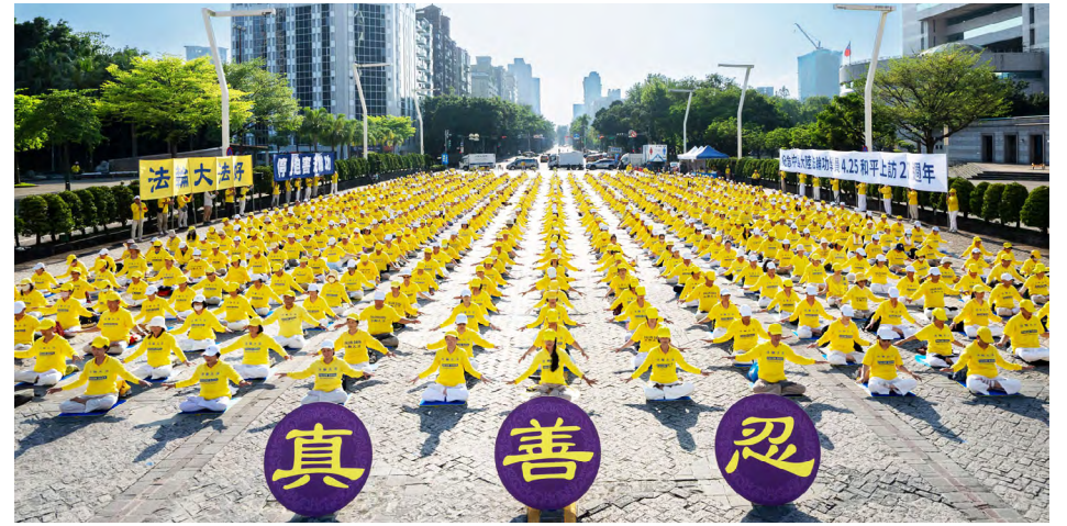
2026年4月19日，法轮功学员在台北市府广场纪念“4·25”和平上访。