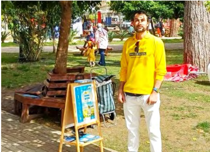
< 艺术家里奥正在参加讲真相活动。