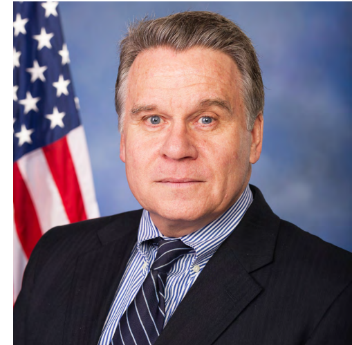
图：美国联邦众议员克里斯·史密斯（Rep. Christopher Smith）

违反制裁规定可能导致最高 25 万美元的民事罚款，或最高 100 万美元的刑事罚款和 20 年监禁。（来源：明慧网）◇