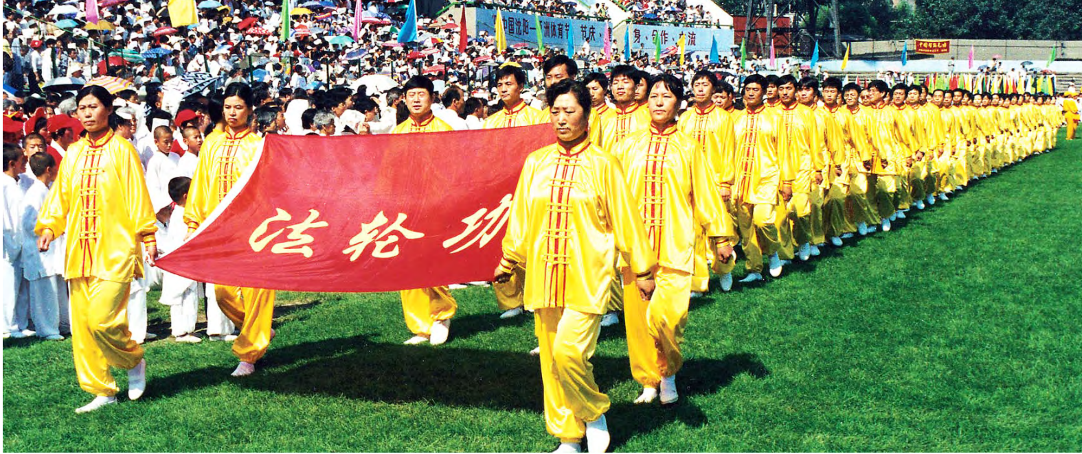
图：1998年8月20日，法轮功队伍在“中国沈阳—亚洲体育节”的开幕式上入场。8月28日，《中国青年报》以《生命的节日》为题介绍体育节上法轮功队伍的良好表现和法轮功的健身效果。