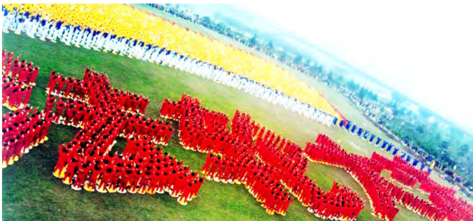
图：1999年3月27日，近万名法轮功学员在武汉汉水公园炼功排字，展现了在中共迫害开始前法轮功在中国大陆弘传的盛况。

● 1998年，中国国家体育总局在北京、武汉、广东等地做了五次医学调查，显示法轮功祛病健身的有效率高达97.9%。