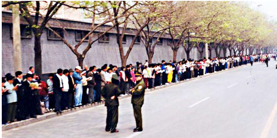
图：1999年4月25日上访现场，法轮功学员静静地站立或看书，警察不用维持秩序，在一旁聊天。法轮功学员没有标语，也没有口号，只是静静地站在那里，只为反映真实情况。

● 1999年4月11日，何祚庥又在天津教育学院的《青少年科技博览》杂志上发表文章，再次引述1998年在北京电视台用过的已被证明为不实的例子诽谤法轮功。