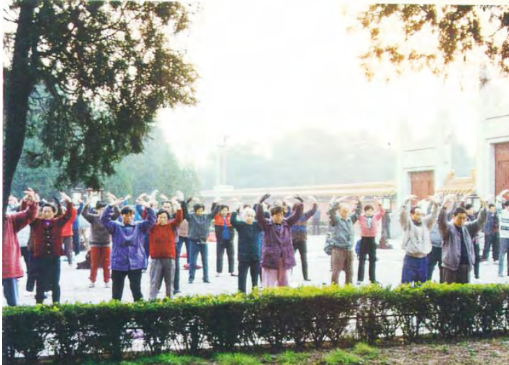
< 1999年中共迫害法轮功之前，北京法轮功学员在地坛公园集体炼功。

为地位，我已有地位；若为幸福的家，我也已拥有，但在学法轮功前我灵魂就一直感到缺失，觉得人生不该只是这样。金钱买不来健康，名利更是过眼烟云。”