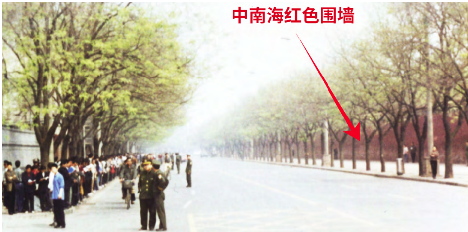
图：1999年4月25日上访现场，和法轮功学员隔街相望的才是中南海的红色围墙，法轮功学员没有“围”住中南海，更没有发生所谓“冲击”事件，所谓“冲击中南海”、“围攻中南海”根本就不存在。