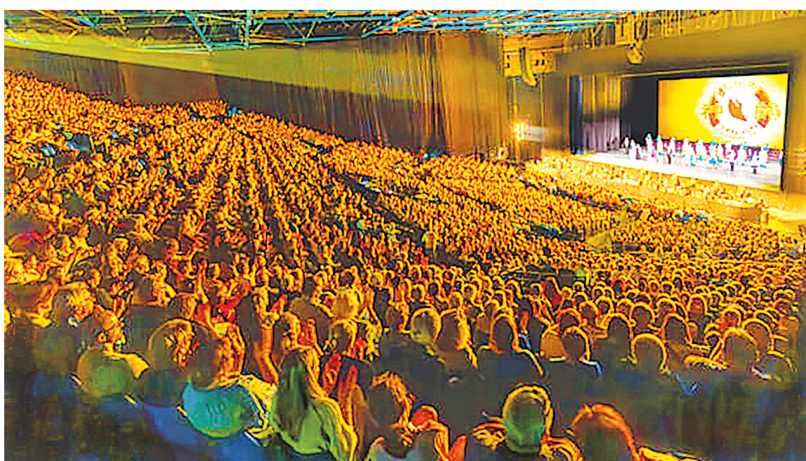
2026年4月27日下午，美国神韵世界艺术团在法国图卢兹 Zénith Toulouse Métropole 剧院的第五场演出爆满。

“我们总是抱怨每天的工作有多忙乱、多疯狂。所以我希望能带领大家回归本心，让他们在混乱的日常中也能尽情享受那份内心的宁静；同时也让他们明白，我们之所以聚在这里，每个人都有其存在的意义。”