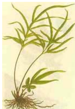
左图：黄裙竹荪 右图：凤尾草

在中医里有许多例子是关于形似即神似的。[1] 比如莲心能清心火；菊花能明目，菊花与眼睛多象形；苦瓜能清胃火，可以想象人的胃是什么形状。形态相象的事物有一种内在的联系。这种联系是因为它们是生命，而且与人体是相通的。