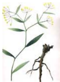
左图：金银花 右图：柴胡