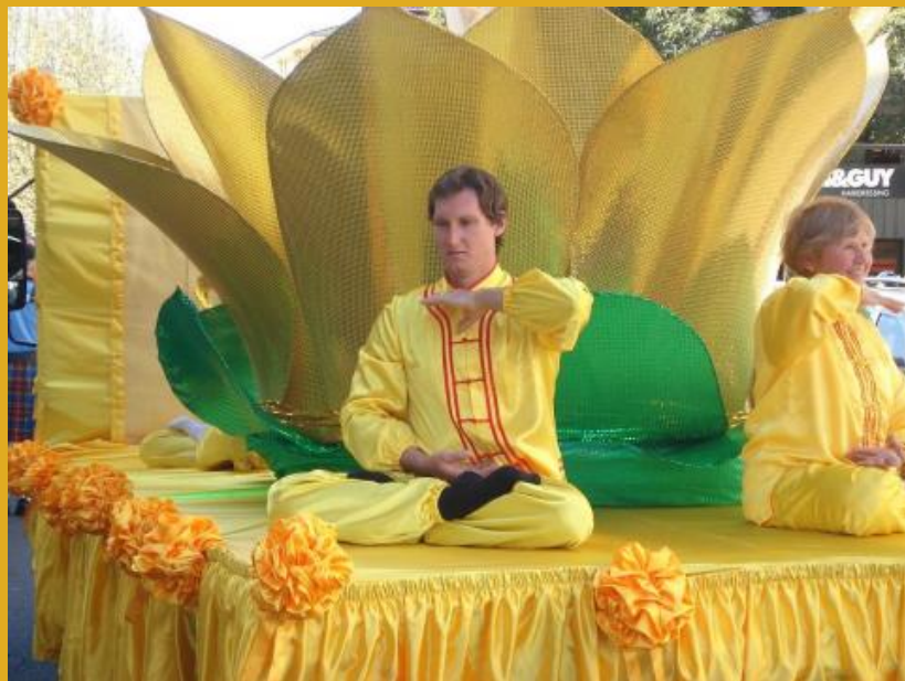
天国乐团应邀参加悉尼多元文化节