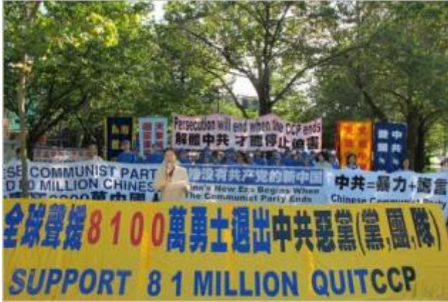
温哥华庆八千万三退 中国城人心觉醒