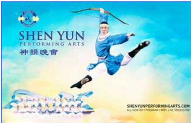
神韵 2011 世界巡演在即