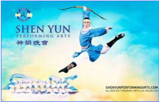
神韵 2011 世界巡演在即