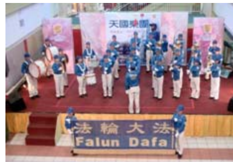
新加坡法轮功学员

在过去的两年中，新加坡天国乐团曾经多次受邀到邻近的马来西亚柔佛州公开表演，悦耳的乐声与震撼的旋律给当地的主办单位和公众留下了深刻的印象。