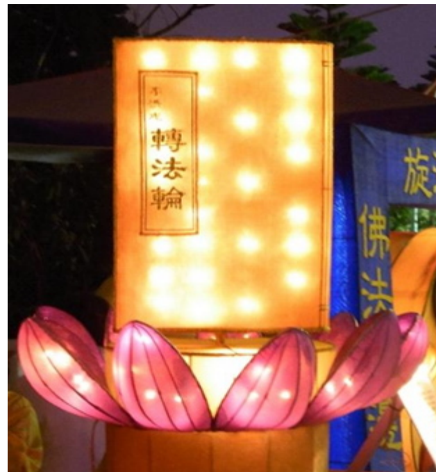
台湾灯会 法轮功学员展现修炼的美好