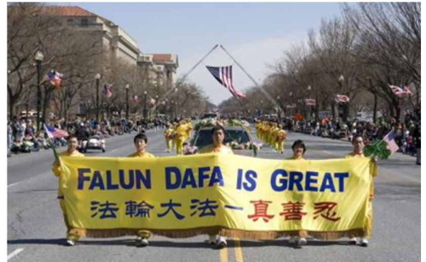
圣.派特里克节大游行 法轮功队伍夺目