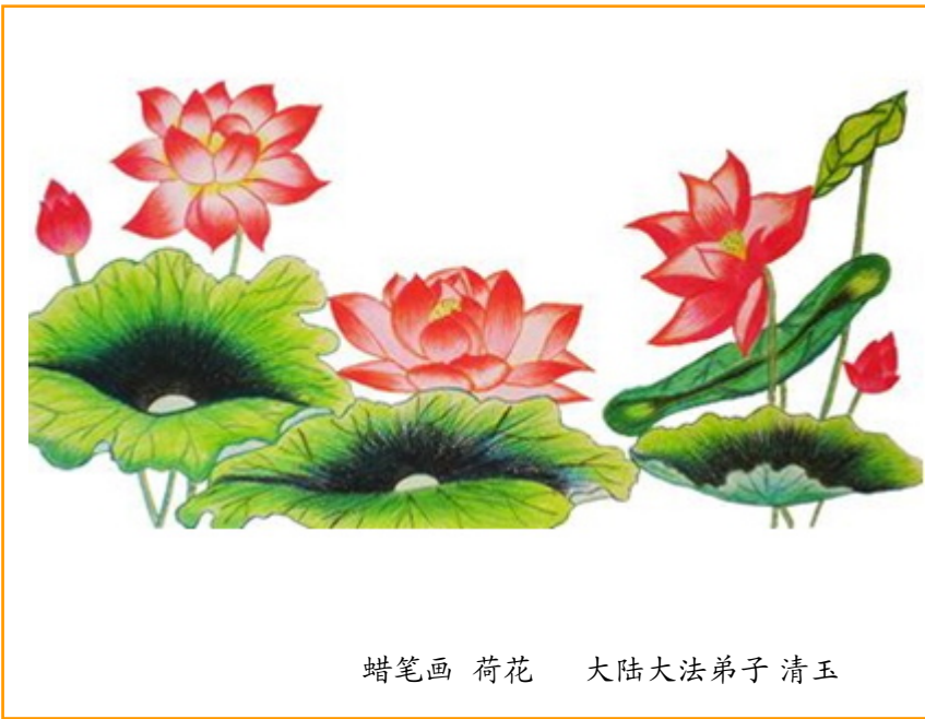
蜡笔画 荷花 大陆大法弟子 清玉