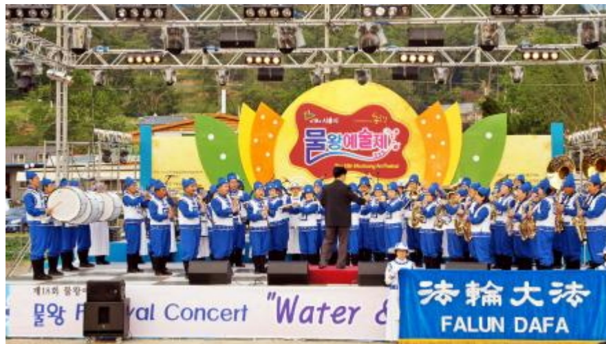
五月二十七日韩国“物旺艺术节”上，天国乐团在特设舞台上演奏