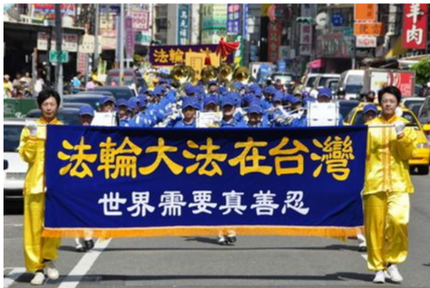
台湾“法轮大法好”主题踩街 民众明真相