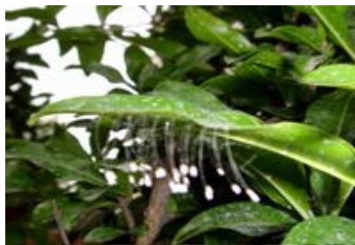
开在石榴树叶子上上的优昙婆罗花

3000 年一开的优昙婆罗花，近日在山东省鲁中地区相继盛开。历史记载：优昙婆罗花是祥瑞之花，属仙界极品，每 3000 年开花一次。优昙婆罗花的直径约 1 毫米，花形如钟，淡白色，花形浑圆，花茎细如金丝。优昙婆罗花开，意味着转轮圣王在人间正法。