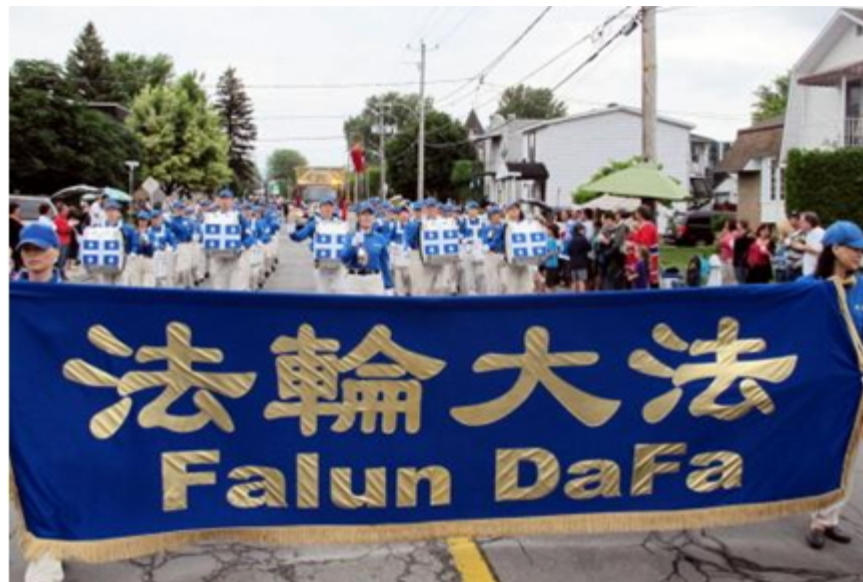
天国乐团应邀参加加拿大魁省省庆游行