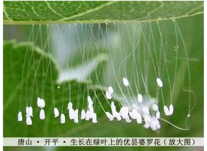
唐山 · 开平 · 生长在绿叶上的优昙婆罗花（放大图）