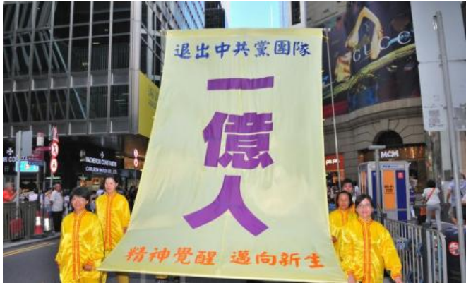
港贺一亿三退 三地游客震撼